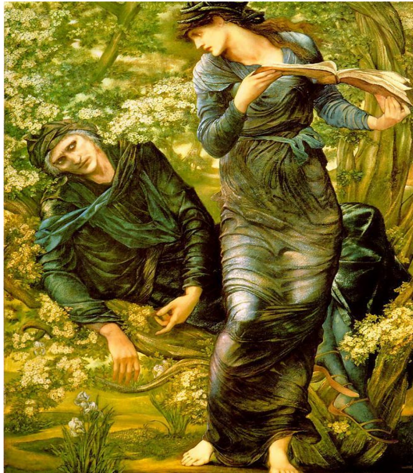
Figura 11: La seducción de Merlín. Edward Burne Jones.

“Solo el sabio mantiene el todo en la mente, jamás olvida el mundo, piensa y actúa con relación al cosmos” Groethuysen