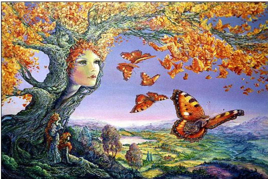
Figura 2: La huida del mundanal ruido. Anónimo.

"Todo lo que le ocurra a la tierra, le ocurrirá a los hijos de la tierra" Jefe indio Seattle