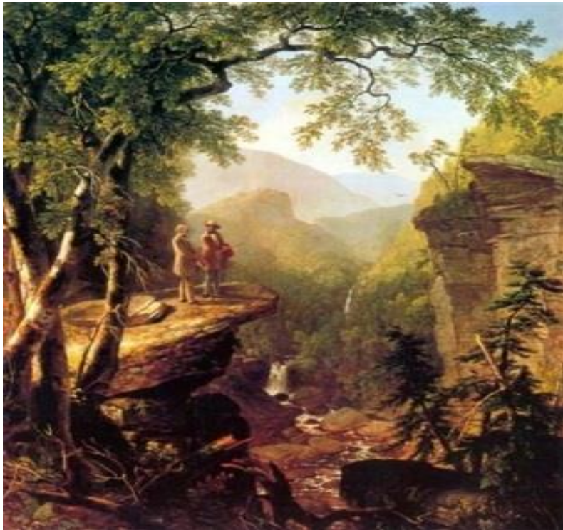
Figura 4: Afinidad de espíritu. Asher Brown Durand.

“Por primera vez el hombre ha comprendido realmente que es un habitante del planeta, y tal vez piensa y actúa de una nueva manera, no solo como un individuo, familia o género, estado o grupo de estados, sino también como planetario” Vernadski.