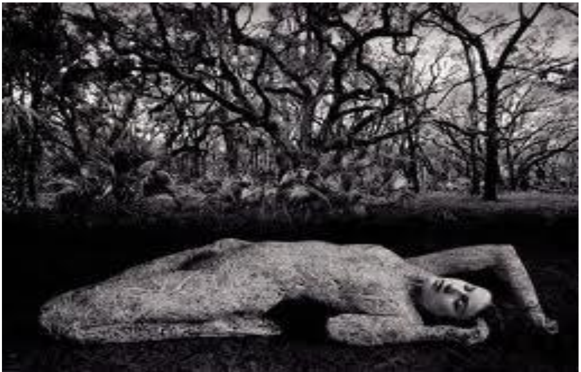
Figura 10: Animal Dreams. Jerry Uelsmann.

“El conocimiento es muy amplio, el mundo inspira al hombre y el hombre transforma su mundo”. Luis Castellanos