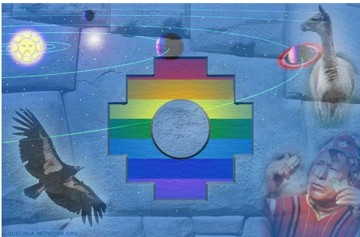
Figura 9: Montaje Quechua. Junio 13 del 2008.

inka, los hermanos Huascar y Atahualpa dejaron de practicar Ayni tal como lo mandaban las leyes morales y judiciales. Para el hombre andino e indígena en general, el medio óptimo de comunicación del alma o espíritu es el sentimiento. Estos sentimientos son transmitidos entre familias, comunidades, generaciones en el tiempo y espacio ( Pacha ) a través de ritos, meditación, canciones, danzas que son las que transmiten con mayor vividez el sentimiento espiritual familiar y colectivo. La palabra o escrituras no fueron la base de la religión o espiritualidad andina debido a que los inkas sabían que la palabra y la escritura son formas muy deficientes para la comunicación espiritual (1997).