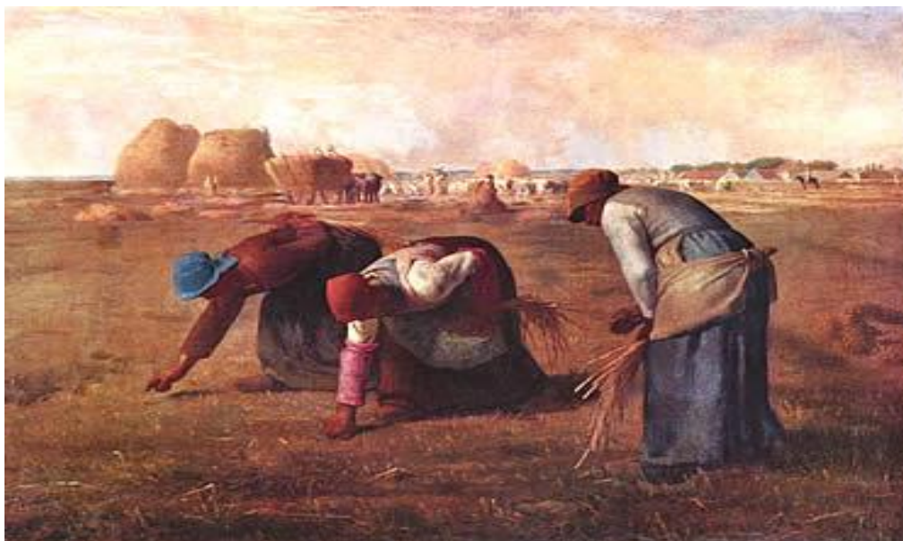
Figura 3: Las espigadoras. Jean Francois Millet.

Las espigadoras de Jean Francois Millet, 1878 es una pintura que muestra el trabajo rural, pero haciendo hincapié en lo social. Tres campesinas ataviadas con la vestimenta típica normanda recogen inclinadas los restos de la cosecha, el trabajo más duro y menos reconocido entre las tareas rurales. Sus posturas reflejan la fatiga que provoca su labor. Los personajes se sitúan en primer plano elevándolos a la categoría de héroes y la iluminación infiere dramatismo a toda la escena.