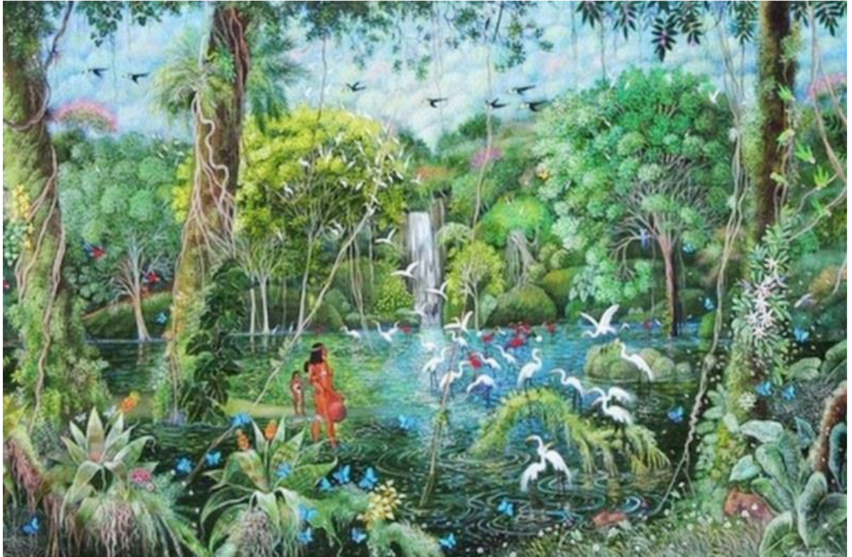
Figura 7: Paisaje Primitivista amazónico. Mara D. Toledo.

“Ni la sociedad, ni el hombre, ni ninguna otra cosa debe sobrepasar los límites establecidos por la naturaleza”. Hipócrates.