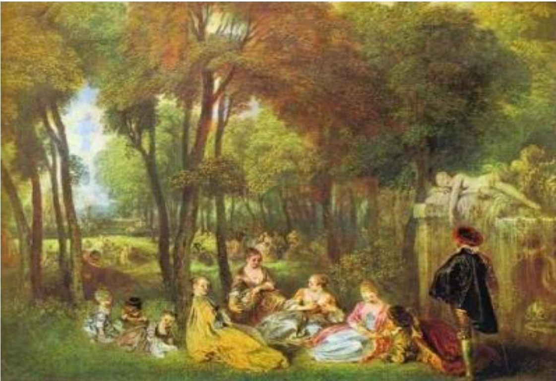
Figura 5: Campos. Jean Antoine Watteau.

La educación ambiental ha sido determinante en el cambio de mentalidad en nuestro contexto frente al respeto y convivencia armónica entre los seres humanos, su cultura y su medio biofísico circundante, de tal manera que, se logren acciones frente a la responsabilidad de nuestras acciones el uso responsable, cuando se habla de educación ambiental se hace referencia a un proceso de aprendizaje, el cual es participativo y permite a cada persona entender y tener un pensamiento crítico frente a la realidad ambiental de su zona, que pueda