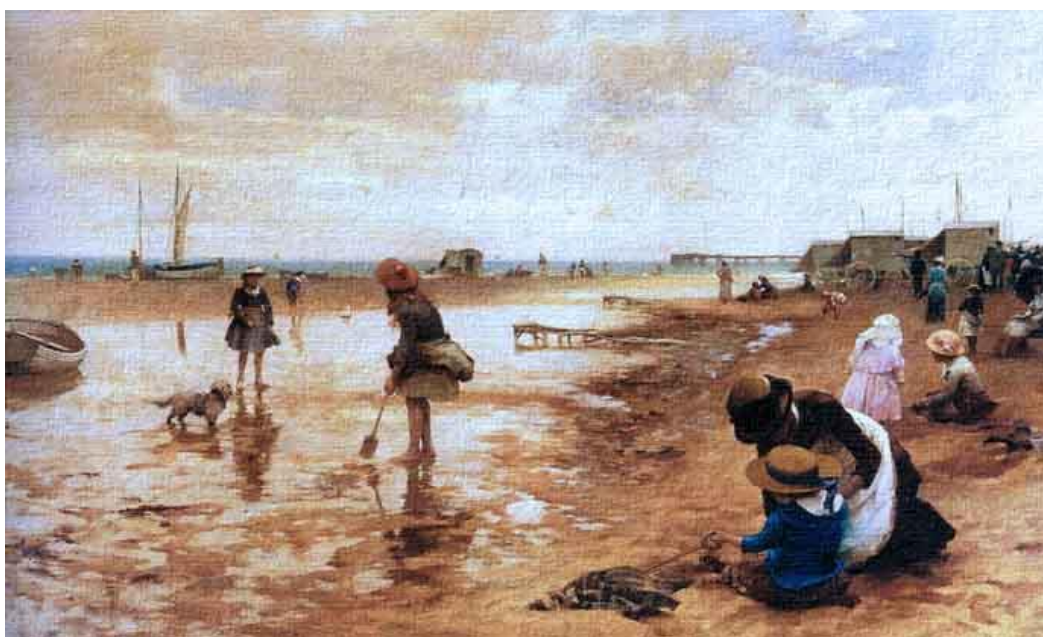
Figura 6: River Landscape. Alfred Augustus Glendening.

”Primero, fue necesario civilizar al hombre en su relación con el hombre. Ahora, es necesario civilizar al hombre en su relación con la naturaleza y los animales”. Victor Hugo.