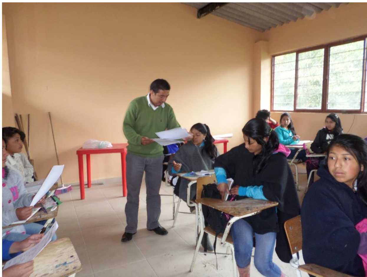
Figura 4. Aplicación de la encuesta sobre accesibilidad a las nuevas tecnologías