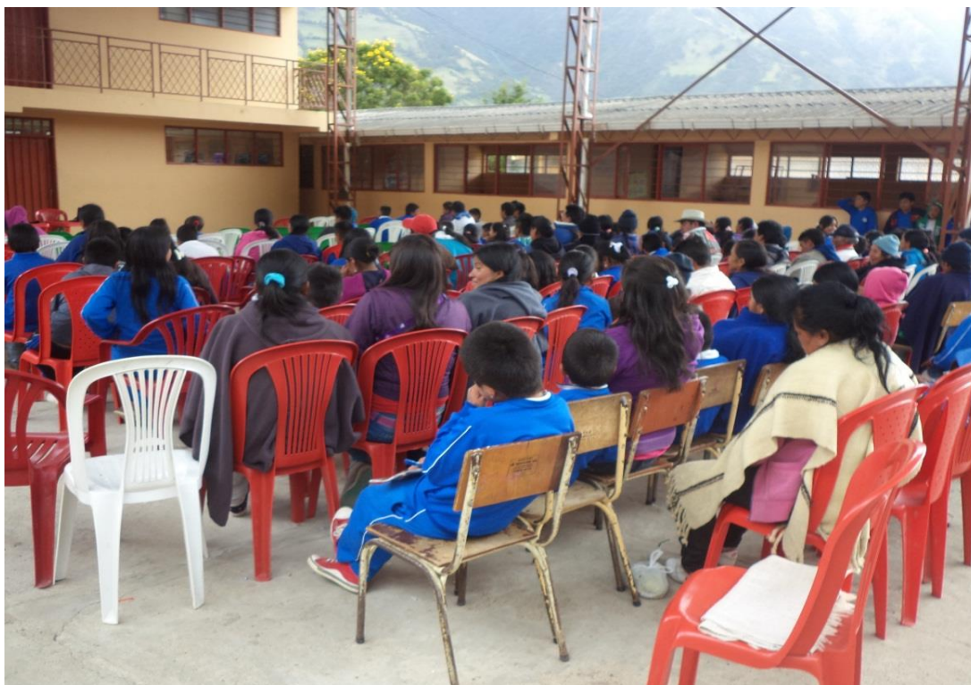
Figura 1. Identificación de los problemas de convivencia en la I.E. de Puebloquemado