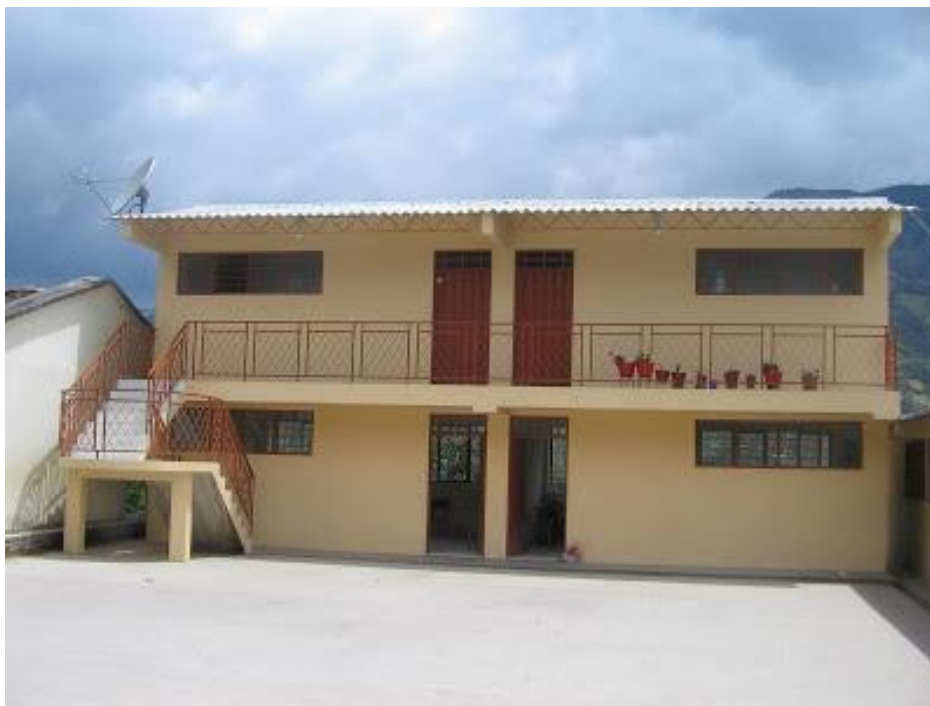
Figura 2. Instalaciones de la Institución Educativa de Puebloquemado

La Institución Educativa Puebloquemado es una Institución de carácter oficial, aprobada por el Ministerio de Educación Nacional y la Secretaria de Educación Departamental Cauca mediante resoluciones No 0435 de abril 26 de 2004 y 05420 del 13 de agosto de 2012 para impartir enseñanza formal a los niveles de educación preescolar, básica primaria y básica secundaria en jornada diurna y calendario A (PEC I.E. Puebloquemado 2014, s.p.) Se encuentra ubicada en la vereda de Puebloquemado, corregimiento de Rioblanco y del Resguardo Indígena que lleva el mismo nombre, hace parte del municipio de Sotará, y del departamento del Cauca, pertenece a un entorno cultural en el que sus habitantes se autodenominan Yanaconas, asentados en el complejo espacio geográfico del Macizo Colombiano, cuyas características especiales han permitido su desarrollo y pervivencia.