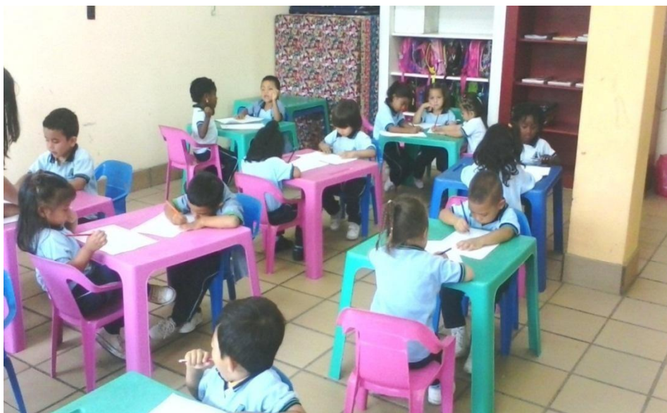
Fotografía 1. Espacio muy reducido para trabajar con 28 niños