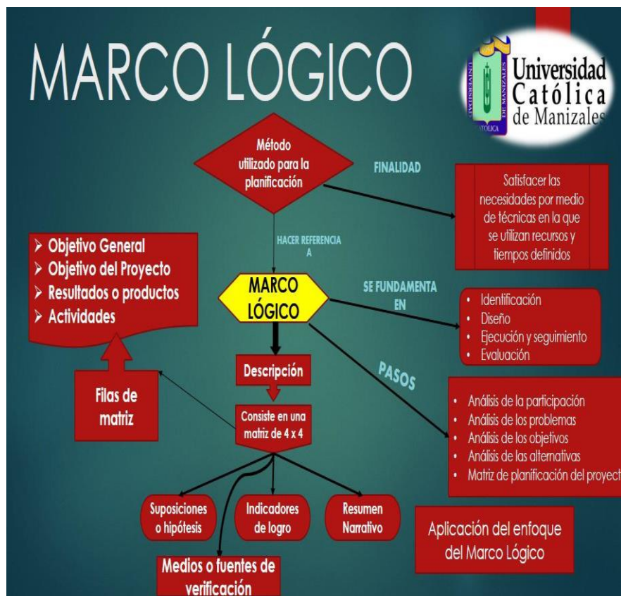
Figura N°1, El enfoque de Marco Lógico

El marco lógico es el método que emplean la mayoría de las agencias internacionales de cooperación para el desarrollo. En él se han estandarizado los siguientes pasos: – Análisis de la participación. – Análisis de los problemas. – Análisis de los objetivos. – Análisis de las alternativas. – Matriz de planificación del proyecto.