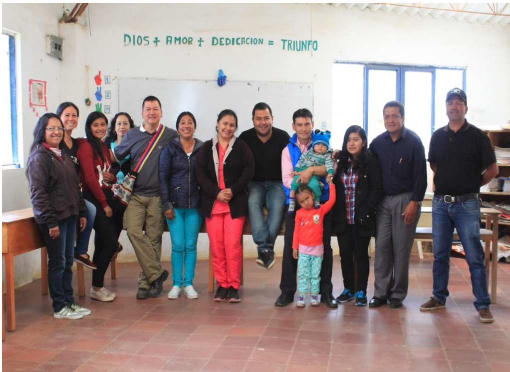
Motivación a docentes para que participen activamente en el proyecto y mejoren sus prácticas pedagógicas.