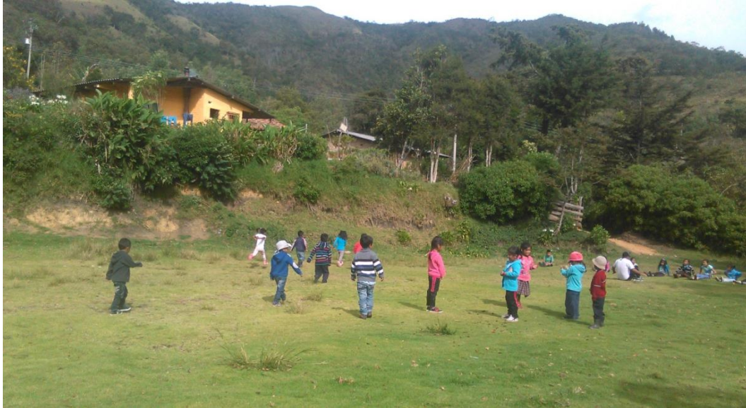
Actividades de integración estudiantil en su propio entorno.