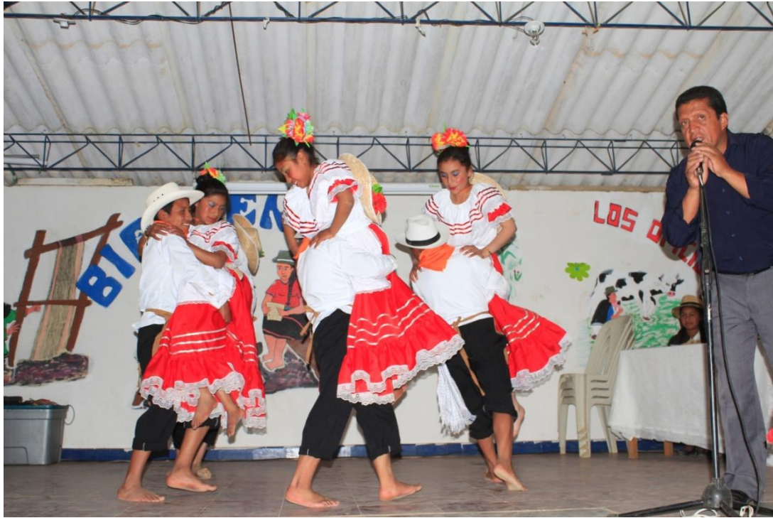
Actividades culturales y deportivas.