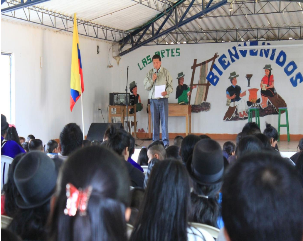
Socialización del proyecto a padres de familia y comunidad en general.