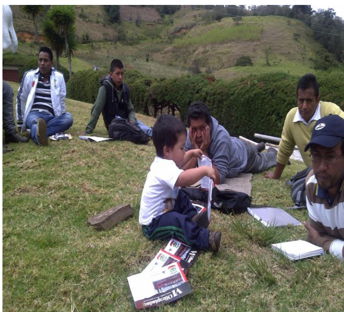
Análisis y discusión grupal sobre las encuestas