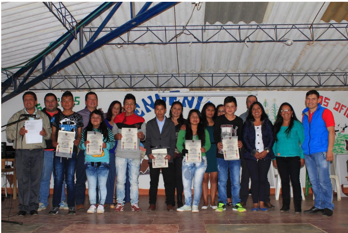
Estímulos a quienes culminan satisfactoriamente cada ciclo de educación. (Grado noveno)