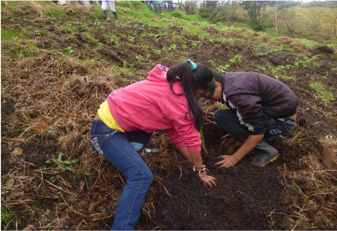
Reforestación y enlucimiento del entorno escolar