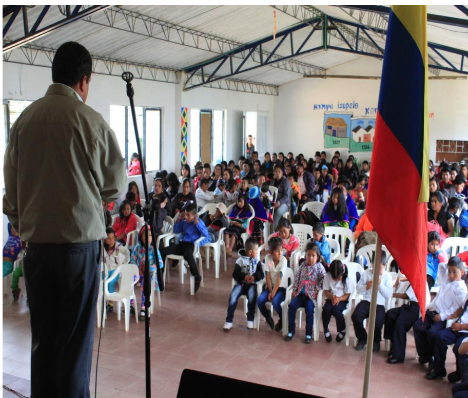
Presentación del proyecto a la comunidad estudiantil.