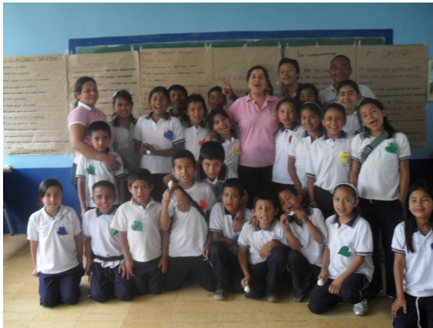
Estudiantes del grado quinto y docentes mediadores de la propuesta.