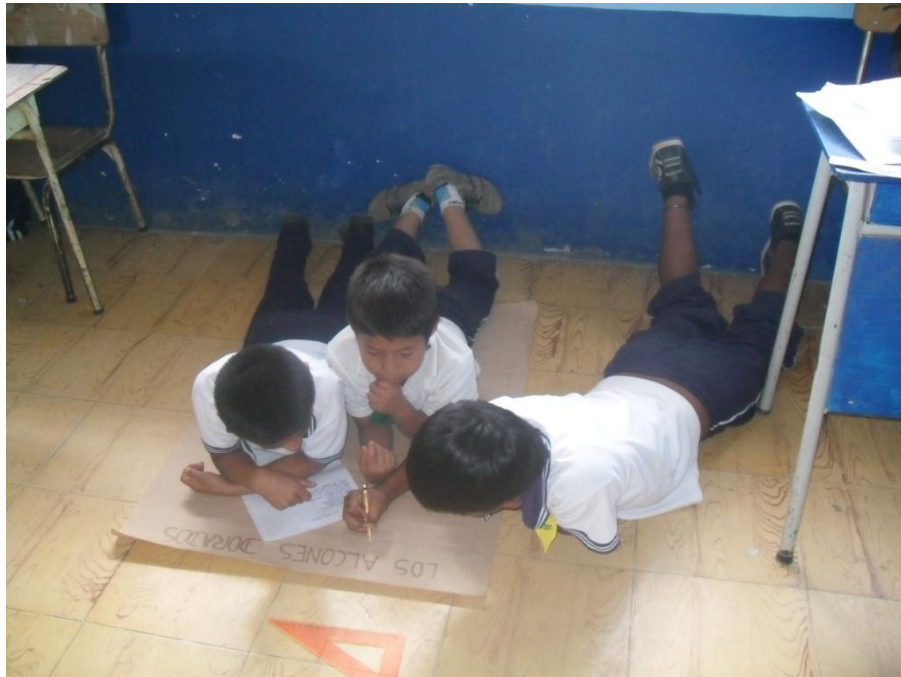
Grupo de trabajo, plantea y escribe posibles soluciones a las dificultades de convivencia.