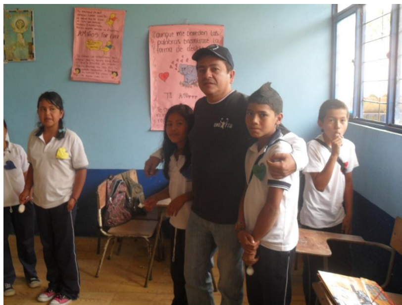
Algunos estudiantes del grado quinto y docente mediador de la propuesta.