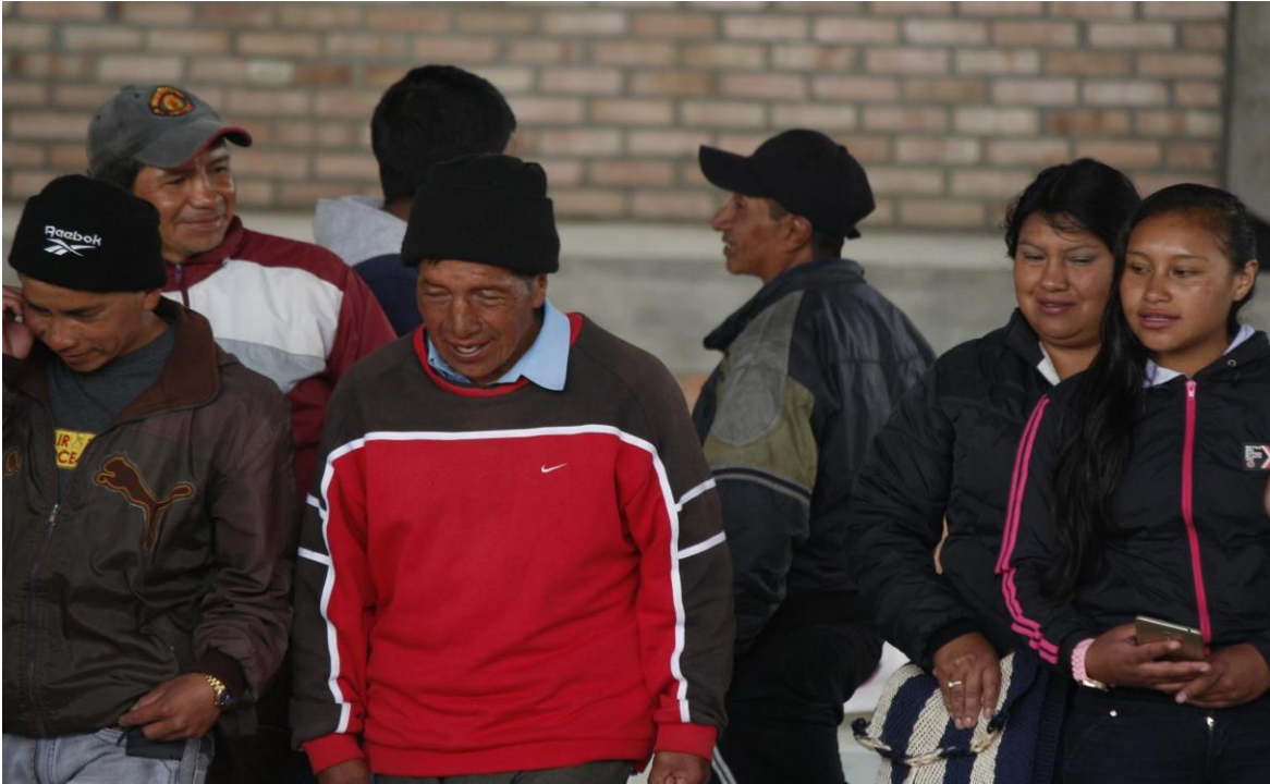
Ilustración 17. Trabajo Social Cabildo Indígena de Puracé, Cauca