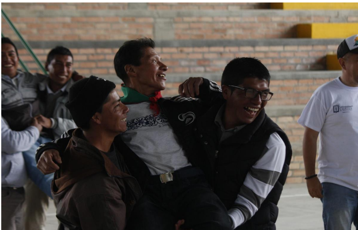
Ilustración 19. Trabajo Social Cabildo Indígena de Puracé