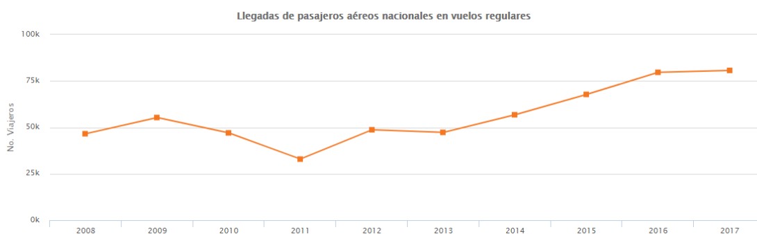
Ilustración 9. Llegadas de pasajeros aéreos nacionales en vuelos regulares