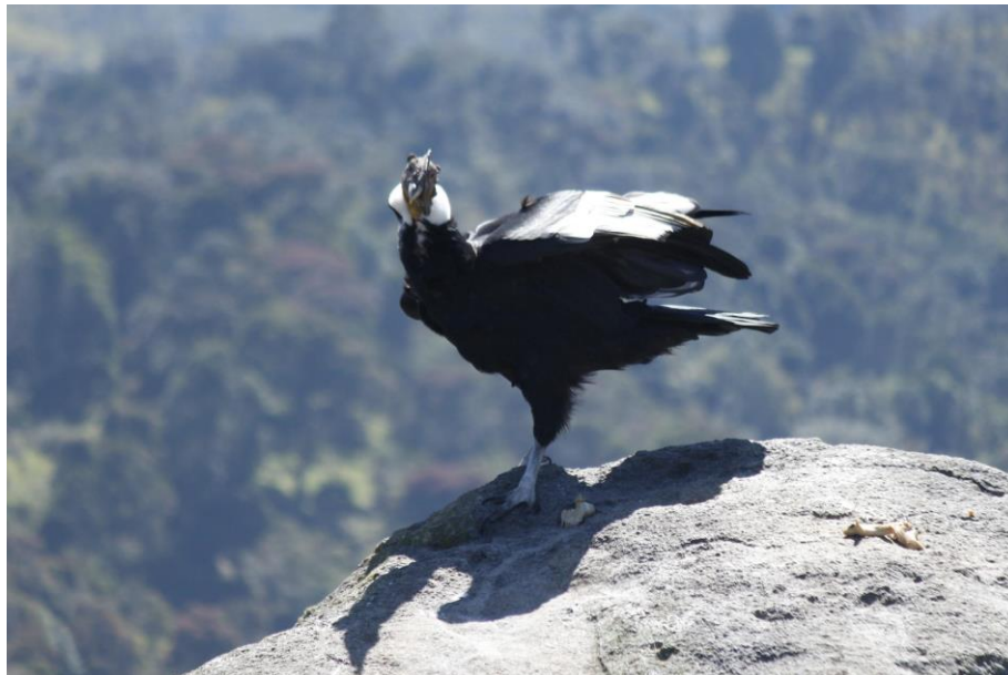
Ilustración 6. vultur gryphus