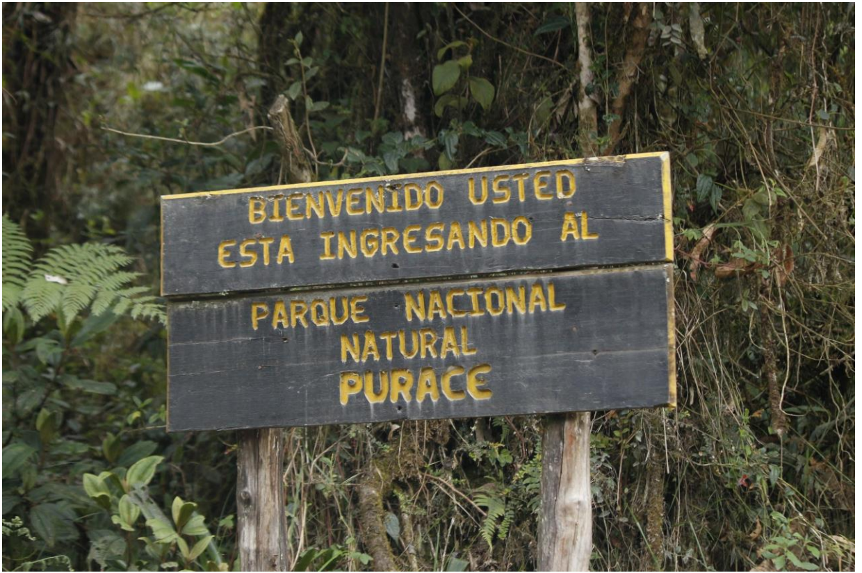
Ilustración 23. Parque Nacional Natural Puracé