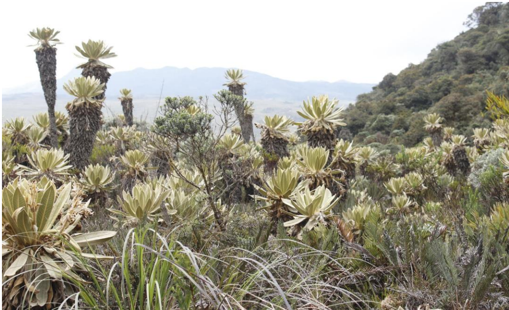
Ilustración 22. Valle de los Frailejones

Fuente: Consultores Profesionales en Turismo UCM.