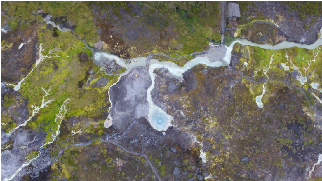
Ilustración 8. Termales de San Juan