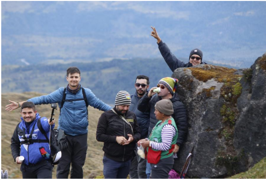
Ilustración 2. Experiencia Ruta Volcán de Fuego