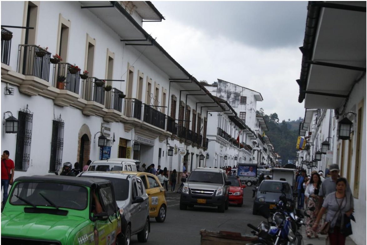
Ilustración 10. Calles Popayán