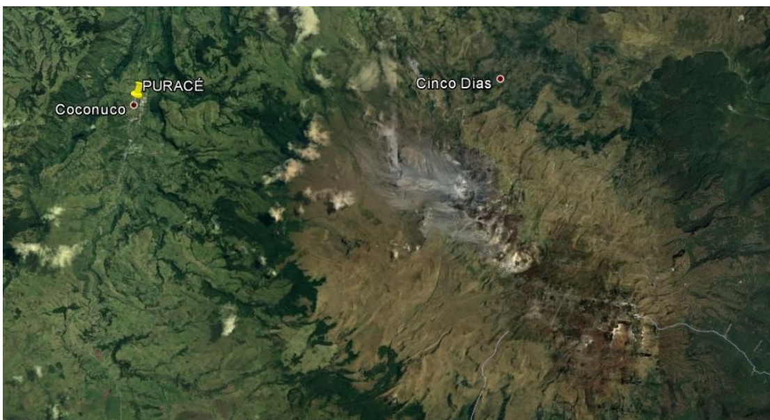
Ilustración 12. Ubicación geográfica del municipio de Puracé y del Nevado Nacional Puracé

El departamento del Cauca es uno de los de mayor importancia en el país debido tanto a su biodiversidad en flora y fauna como por su historia y riqueza. Su capital, Popayán, es una de las ciudades más destacadas. Durante muchos años fue el centro económico y político de todo el territorio de la Gran Colombia. Es en este departamento, y muy cerca de su capital, que se encuentra el municipio de Puracé, a una distancia de 30 km y en pleno centro occidente. Su ubicación está dentro del macizo Colombiano de la Cordillera Central de los Andes, sobre la orilla derecha del Río Cauca. Además, hace parte del Corredor Ecológico del Parque Nacional Natural Puracé.