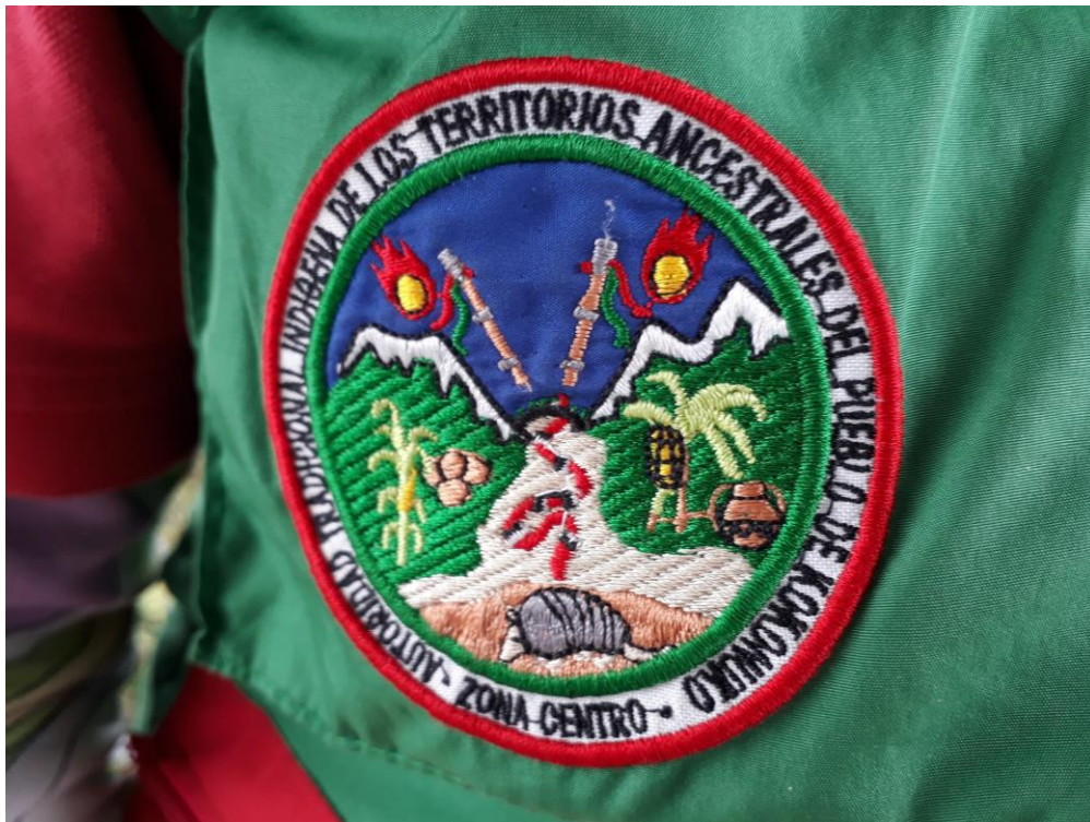
Ilustración 14. Logo Informador Turístico Local Comunitarios

Fuente: Consultores Profesionales en Turismo UCM.