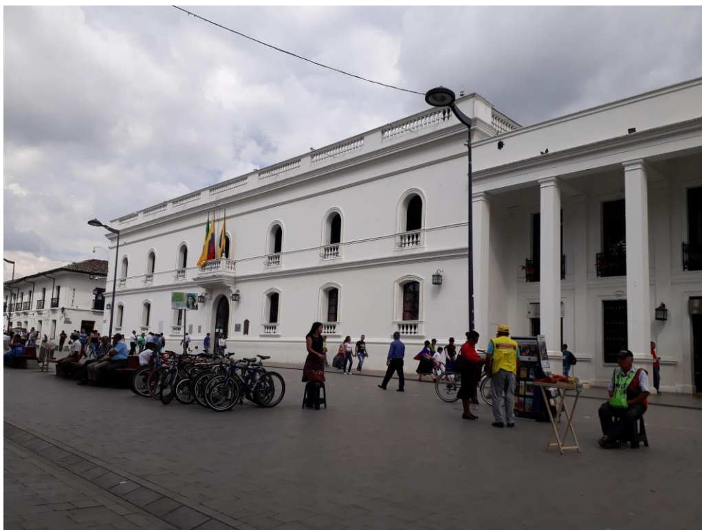
Ilustración 11. Parque Central de Popayán