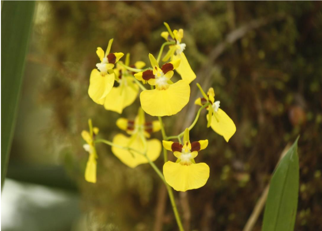
Ilustración 21. Orquídea Parque Nacional Natural Puracé