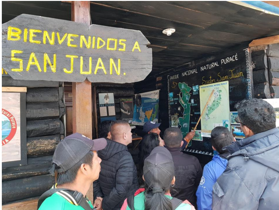
Ilustración 7. Parque Nacional Natural Puracé