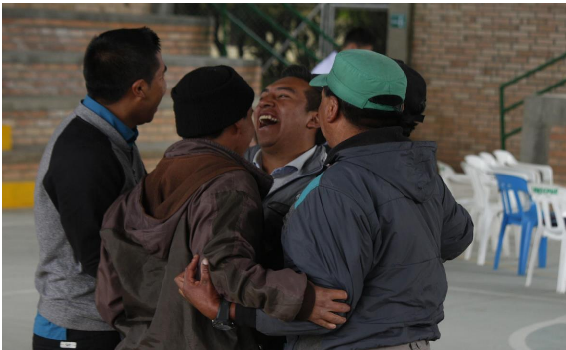
Ilustración 18. Trabajo Social Cabildo Indígena de Puracé, Cauca