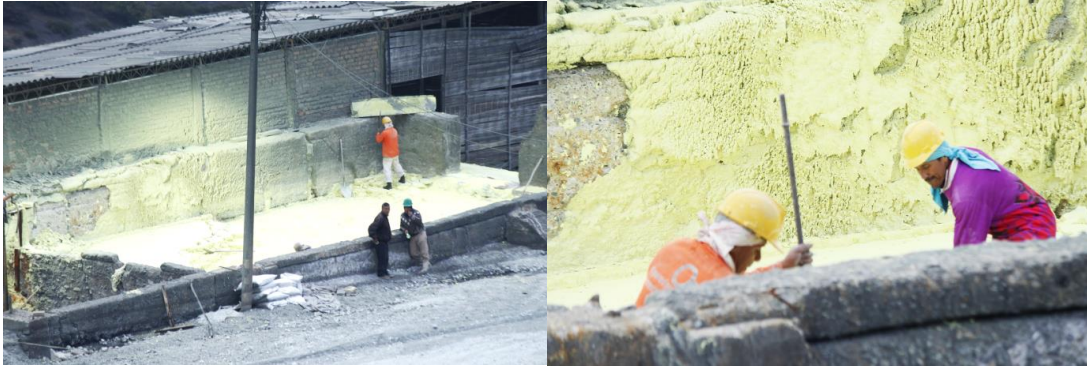
Ilustración 20. Extracción de Azufre