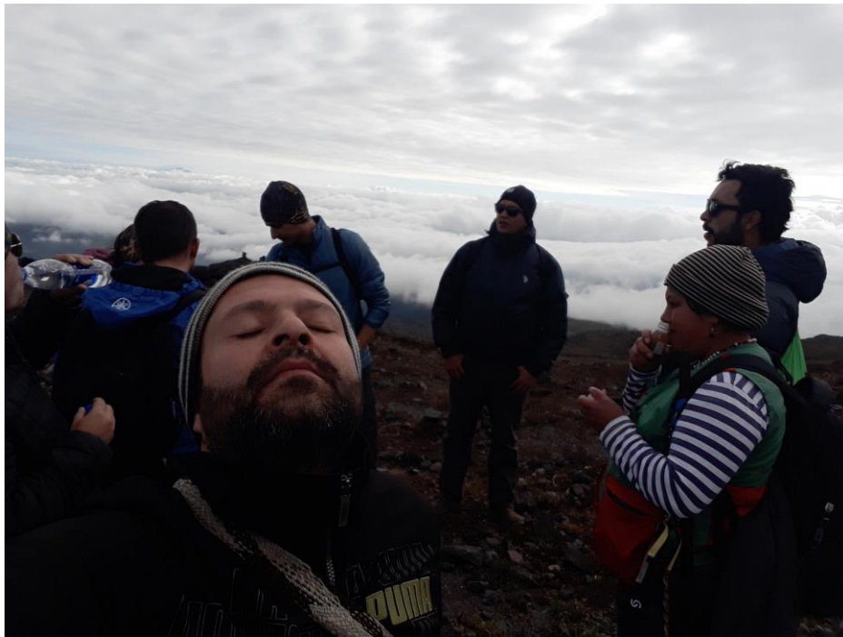
Ilustración 3. Conectados con el León Dormido