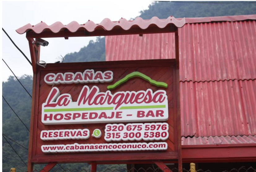
Ilustración 4. Cabañas la Marquesa

Fuente: Consultores Profesionales en Turismo UCM - Prestador de servicio Turístico.