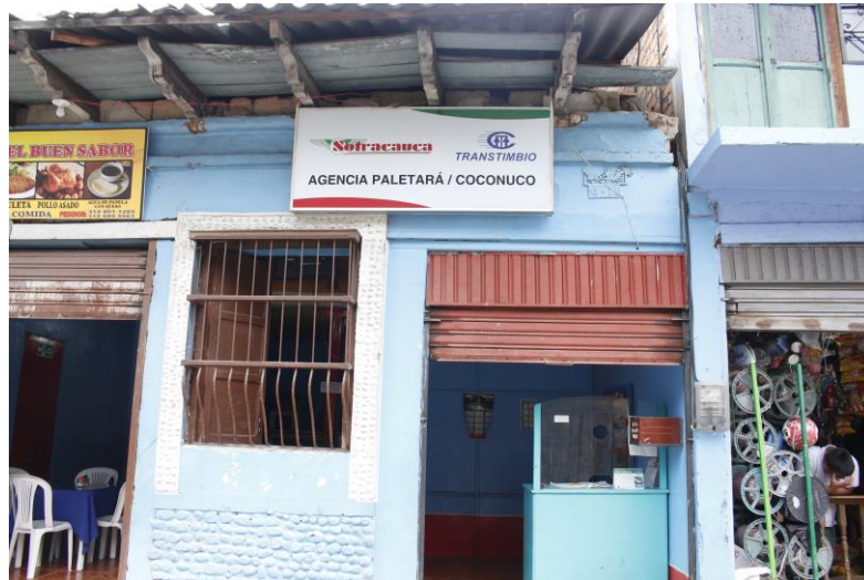
Ilustración 5. Prestador de servicios de Transporte