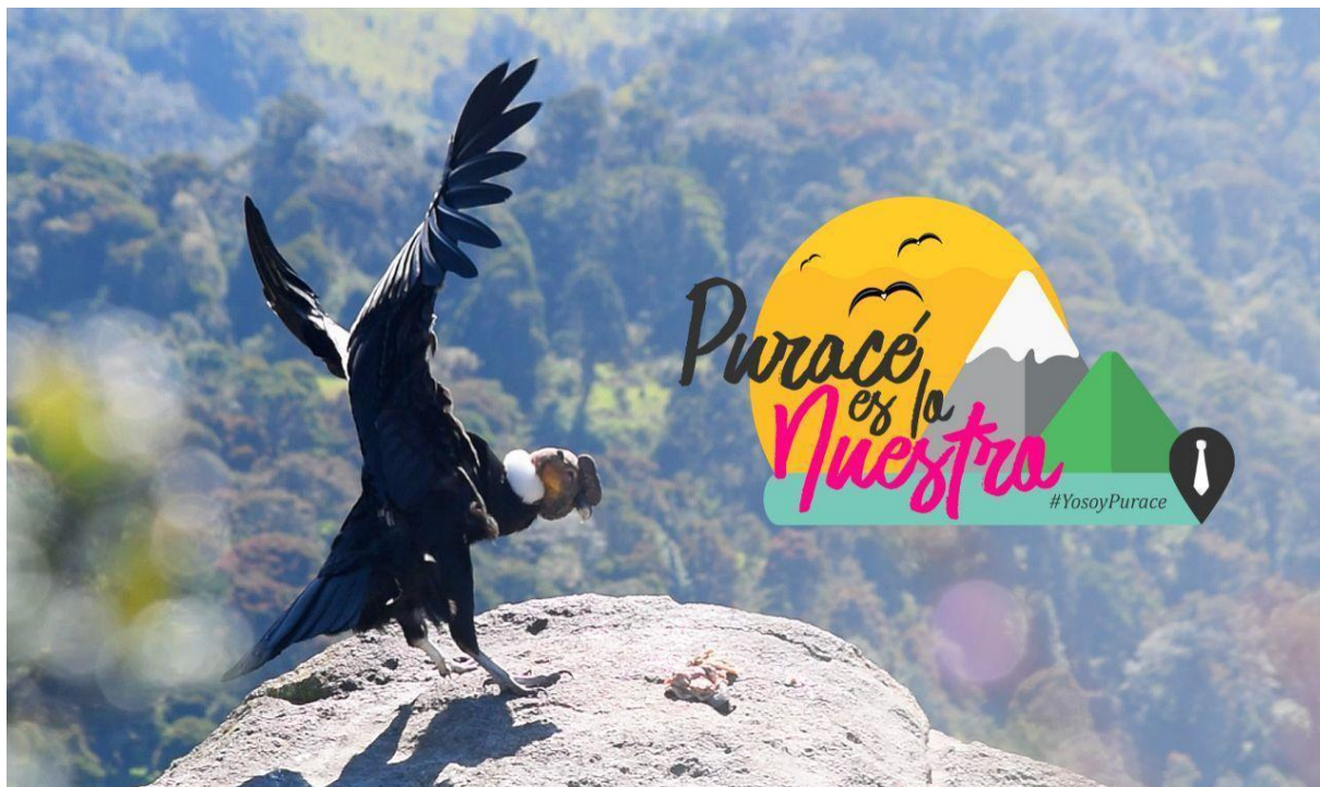
Ilustración 1. Apropiación de Marca Puracé es lo Nuestro