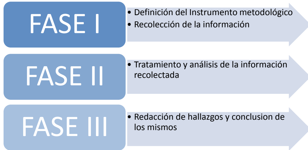
Figura 1. Esquema de las fases metodológicas.