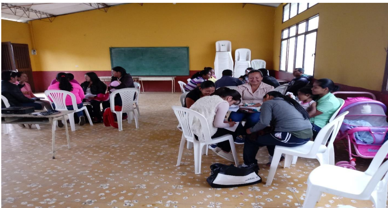
Actividad lectoescritora con docentes