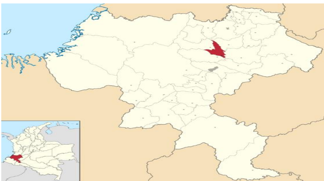
Figura 1. Municipio de Piendamó Cauca

El Municipio de Piendamó se encuentra localizado en la subregión centro-norte del Departamento del Cauca (Meseta de Popayán) a 2 38´ 27´´ latitud norte y 76 31´ 48´´ longitud oeste, parte media de la región montañosa de la subcuenca del Río Piendamó, sobre la vertiente occidental de la cordillera central de los Andes. Su cabecera Municipal se ubica a 25 kilómetros de la Ciudad de Popayán y 75 km de la Ciudad de Cali Valle. Su extensión total es de 188.42 Km 2 y cuenta con una altura promedio entre 1.200 y 2.300 m.s.n.m., pisos térmicos: frío (2.000-2.300 m.s.n.m.) y templado (1.200-2.300 m.s.n.m.) una temperatura promedio de 18°C. Sus límites son: al Norte con el Municipio de Caldono, al Sur limita con Cajibío, al Occidente con Morales y al Oriente con el Municipio de Silvia (Figura 1) Plan de Desarrollo Municipal, 2008, p. 28).