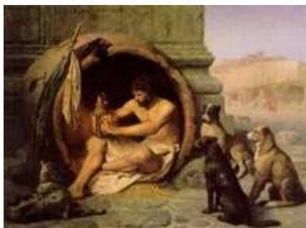
Jean-Léon Gérôme, 1860