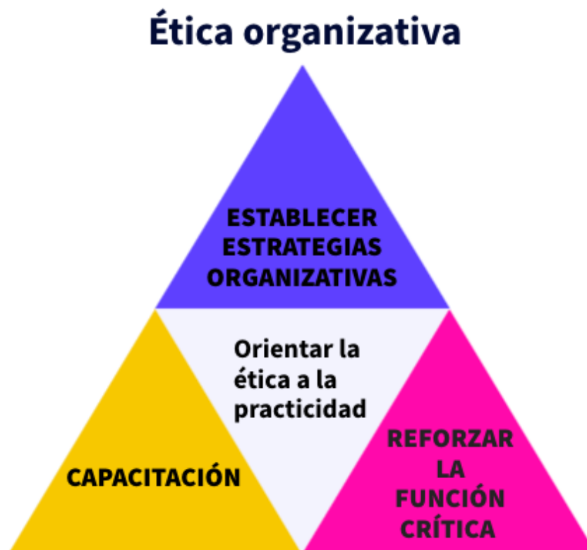
Gráfico: ética organizativa.