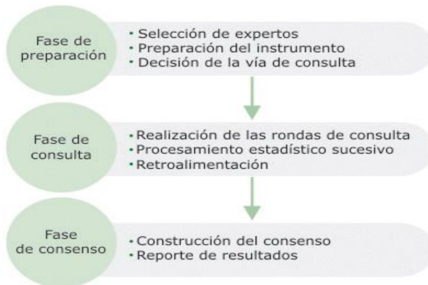
Fig. Sistematización del procedimiento de realización del método Delphi.

Diseño de la Técnica: La Entrevista semi-estructurada: Con respecto al desarrollo de la entrevista, se tuvo en cuenta que esta técnica versó en torno a acontecimientos vividos y aspectos subjetivos de la persona tales como creencias.