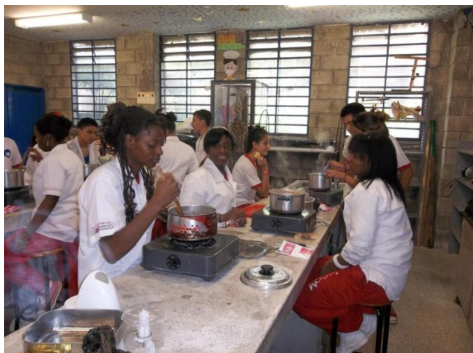
Figura 3. Práctica de laboratorio escolar