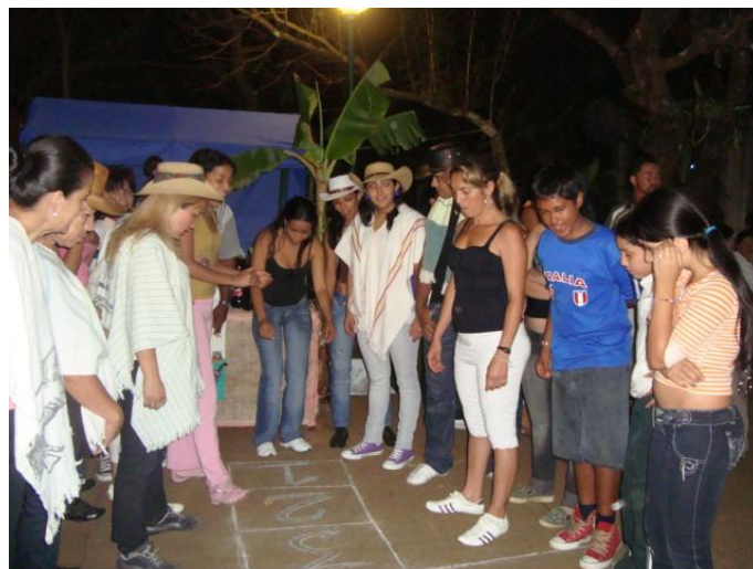
Figura 6. Jornada lúdica escolar del Colegio de desarrollo social para la atención integral al joven "Talita Cumi" Educación para jóvenes adultos. Juegos callejeros.