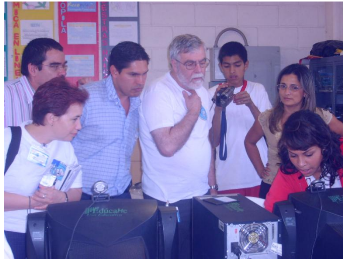
Figura 9. Visita de una escuela inglesa para ver la propuesta de macroproyecto que se maneja en el colegio, la estudiante explica el asunto. Institución Educativa Gabriel García Márquez

A manera de cierre apertura, de estos ejemplos liberadores de experiencias pedagógicas, las que no pretende agotar el compendio de prácticas pedagógicas exitosas existentes y que no se ha mencionado en ésta obra, se considera que la idea en realidad es dejar ver una pequeña muestra de la excelente labor que muchos docentes vienen realizando y que los convierte desde el conocimiento y la praxis misma en soles de conocimiento alrededor de los cuales giran sus cometas los discípulos, y que les permitirá encontrar su correcta órbita; es más, queremos dar una luz al quehacer educativo que, desde tiempo atrás viene decayendo, y que es muy valioso para los resultados de éxito que se pretenden alcanzar dentro de la sociedad colombiana.