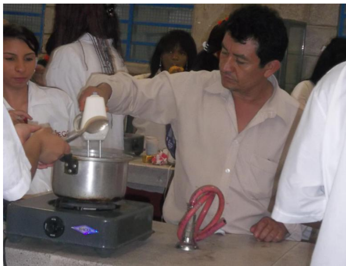
Figura 2. Práctica de laboratorio escolar

A continuación fotografías de las prácticas de laboratorio realizados con estudiantes: