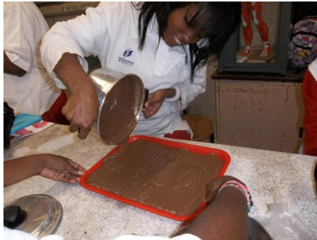
Figura 4. Práctica de laboratorio escolar