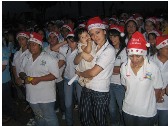
Figura 5. Jornada lúdica escolar del Colegio de desarrollo social para la atención integral al joven "Talita Cumi" Educación para jóvenes adultos. Navidad.

debido a su precaria condición económica (nuevos soles), convirtiéndose así la escuela en un espacio de relax (órbita), sana convivencia y sosiego, que finalmente les permite equilibrar sus procesos personales y familiares para no enloquecer dentro de ésta poco pacífica y cambiante sociedad.