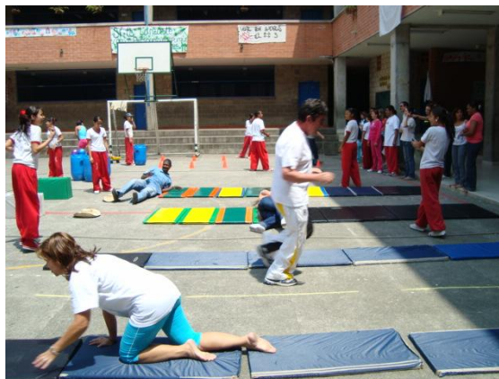
Figura 8. Juegos múltiples para profesores dirigidos por estudiantes en la Institución Educativa Gabriel García Márquez

unos lideran otros se benefician del proceso encausado. Esta actividad recoge los proyectos legalmente establecidos y los generados por la Institución, en el caso en cuestión se dividen en: monitores en línea , quienes se responsabilizan de las salas de sistemas y las aulas móviles ( laptops ) que se reservan y utilizan de acuerdo a las necesidades de los docentes y estudiantes y que no necesariamente trabajan en el área de tecnología e informática; periódico escolar , en dos tipos de presentación: impresa y virtual, éste recoge los eventos más importantes de toda la comunidad educativa; biblioteca escolar , los estudiantes administran los bibliobancos de las aulas y la biblioteca escolar como centro de recurso intelectual escrito desde el libro; inventario , donde los jóvenes se encargan de administrar y entregar los recursos: muebles y enseres que previamente son inventariados y entregados anualmente a cada docente, directivo docente, personal administrativo y de servicios generales; están los proyectos de ley que están previamente establecidos y que sabemos pretenden generar mayor integralidad de los docentes desde los procesos de aprendizaje establecidos en cada centro educativo.