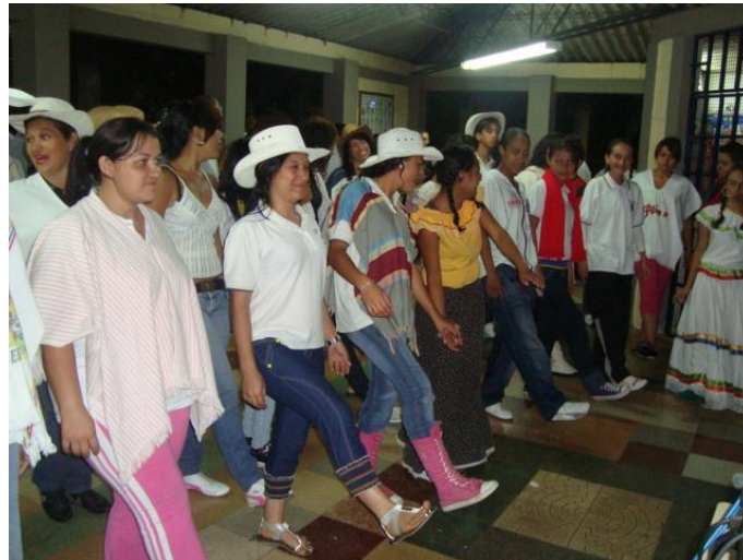
Figura 7. Jornada lúdica escolar del Colegio de desarrollo social para la atención integral al joven "Talita Cumi" Educación para jóvenes adultos. Antioqueñidad