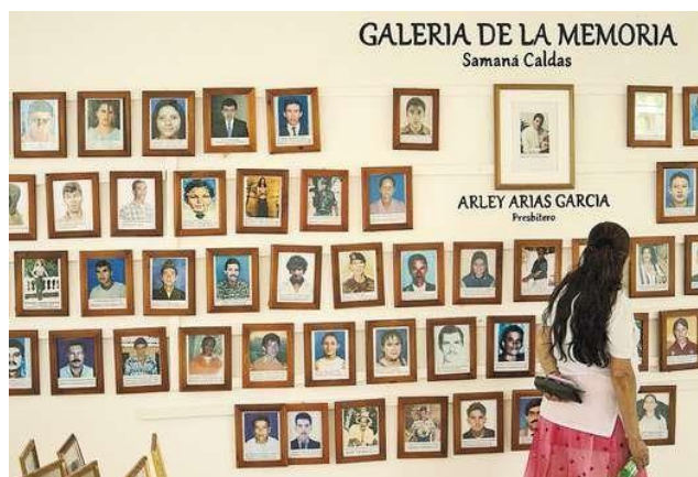
Foto tomada por Juan David Tamayo para el periódico El Espectador, 2017

Según la nota de prensa del Espectador (2017) estas microhistorias las elaboran los integrantes de Renacer, la asociación de víctimas de desaparición forzada y homicidios de Samaná (Caldas), con el acompañamiento de la organización Fundecos y el apoyo del Centro Nacional de Memoria Histórica.