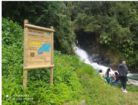
Fotografía tomada por Johan Daniel Ospina, (Travesía, 2021)