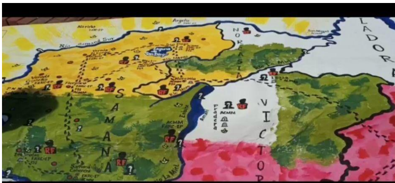
La Dorada, Caldas, Travesía 2021