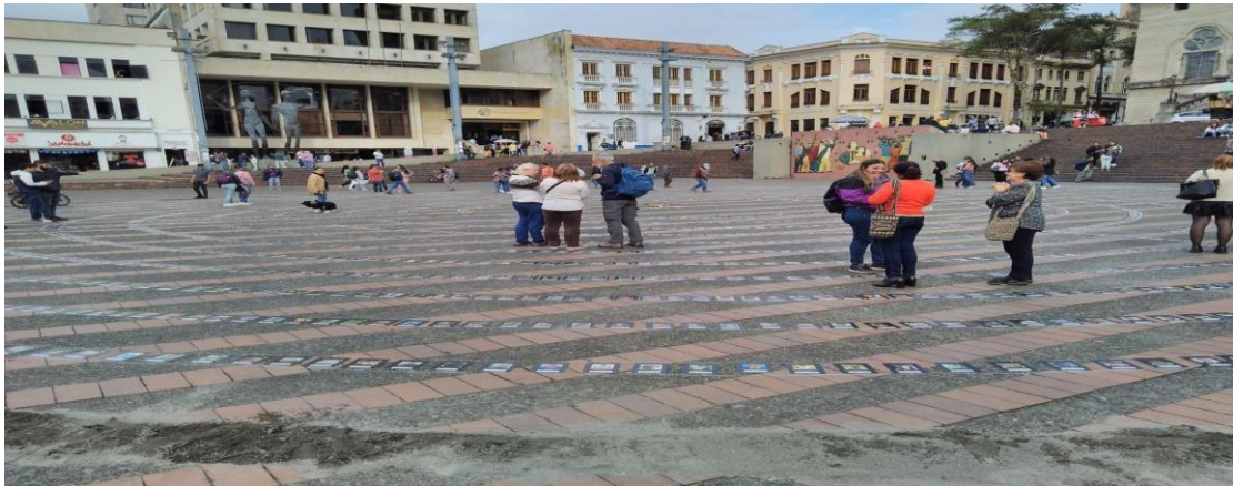
Fotografía tomada por Johan Daniel Ospina, Manizales, 2023