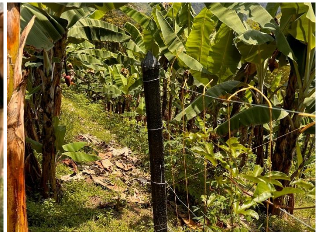
Ilustración 20: Platanera. Elaboración Propia.