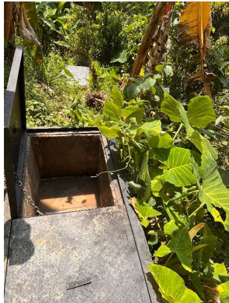
Ilustración 17: Filtro Retorno del Agua. Elaboración Propia.