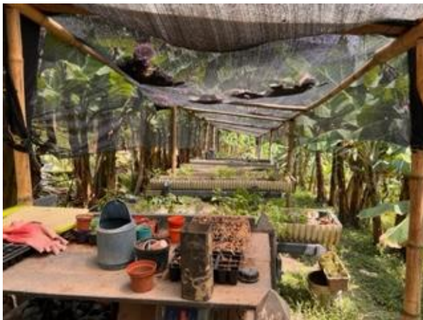
Ilustración 19: Huerta Orgánica. Elaboración Propia.