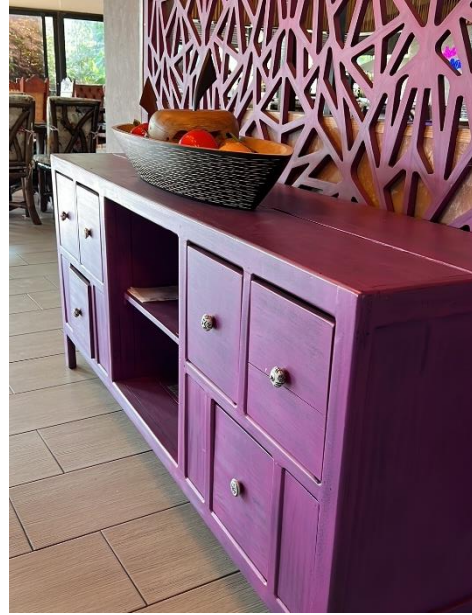
Ilustración 21: Sala Reciclada. Elaboración Propia.