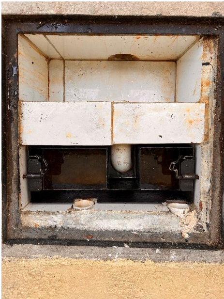
Ilustración 16: Trampa de Grasas. Elaboración Propia.