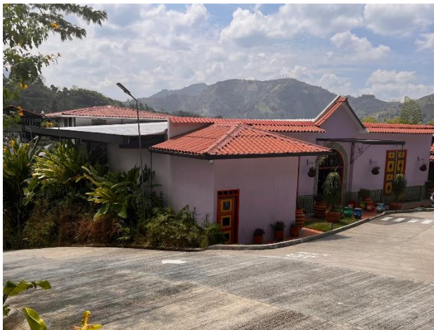
Ilustración 11: Fachada Principal. Elaboración Propia.