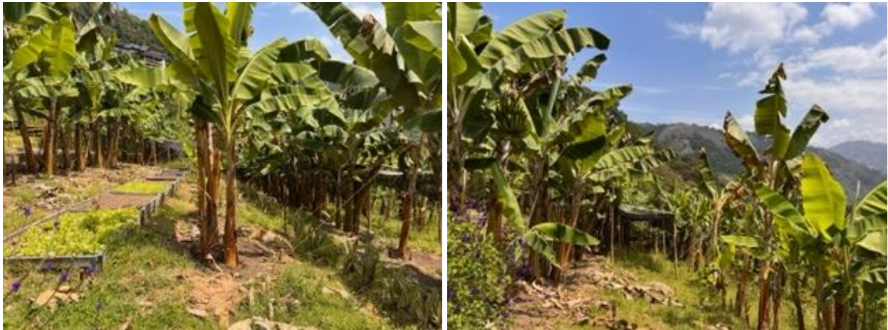
Ilustración 4: Huerta Orgánica. Elaboración Propia.