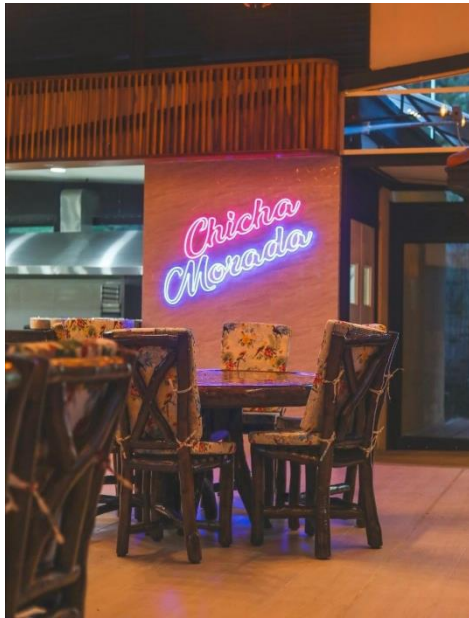
Ilustración 9: Chicha Morada. Elaboración Propia.