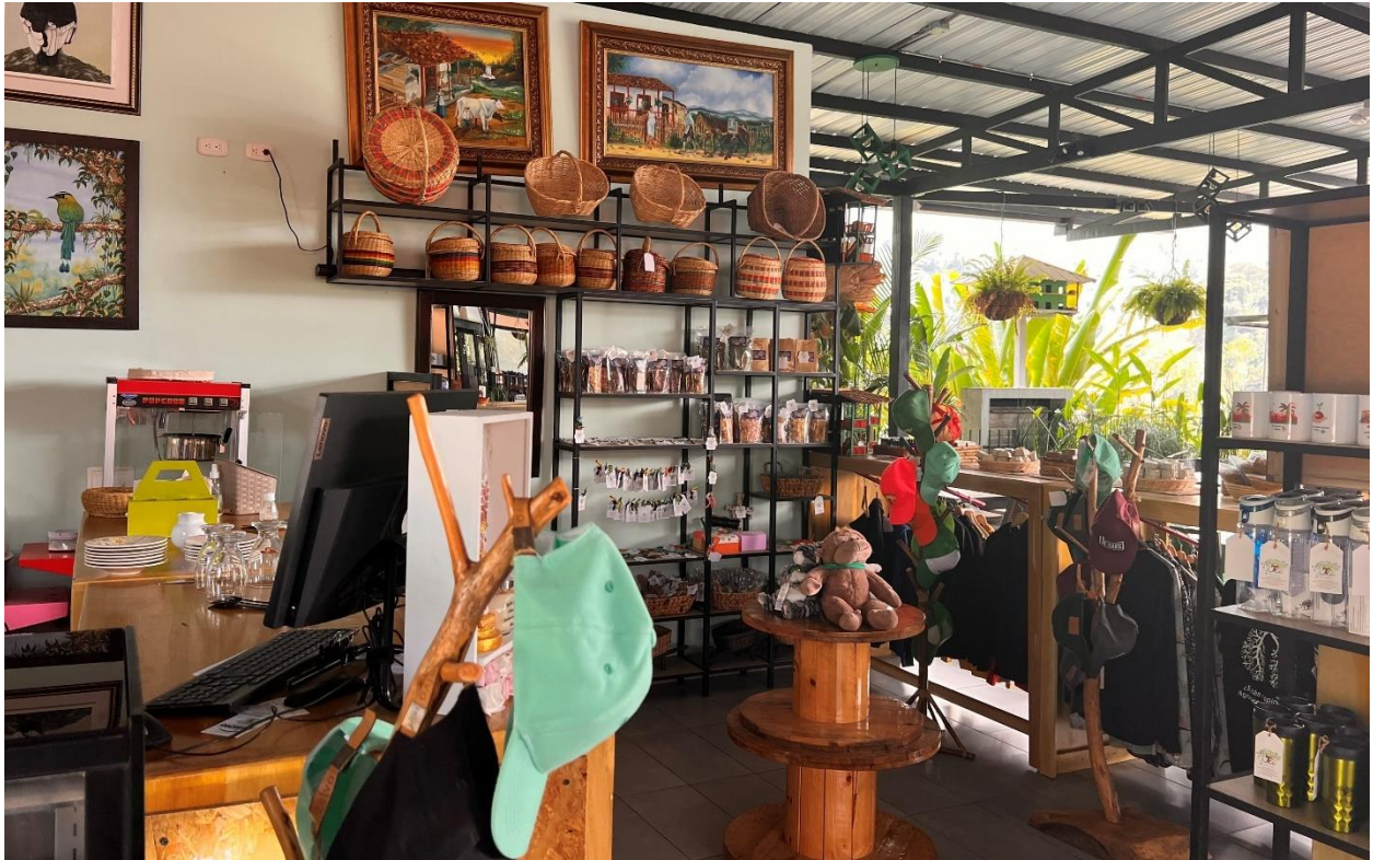
Ilustración 13: Tienda de Artesanías y Souvenirs. Elaboración Propia.