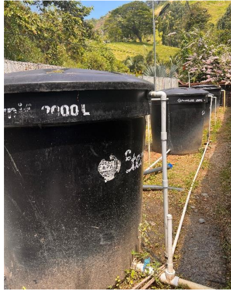
Ilustración 15: Tanques de Almacenamiento. Elaboración Propia.