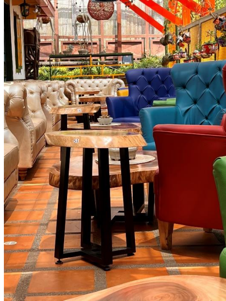
Ilustración 10: Salento Boulevard. Elaboración Propia.