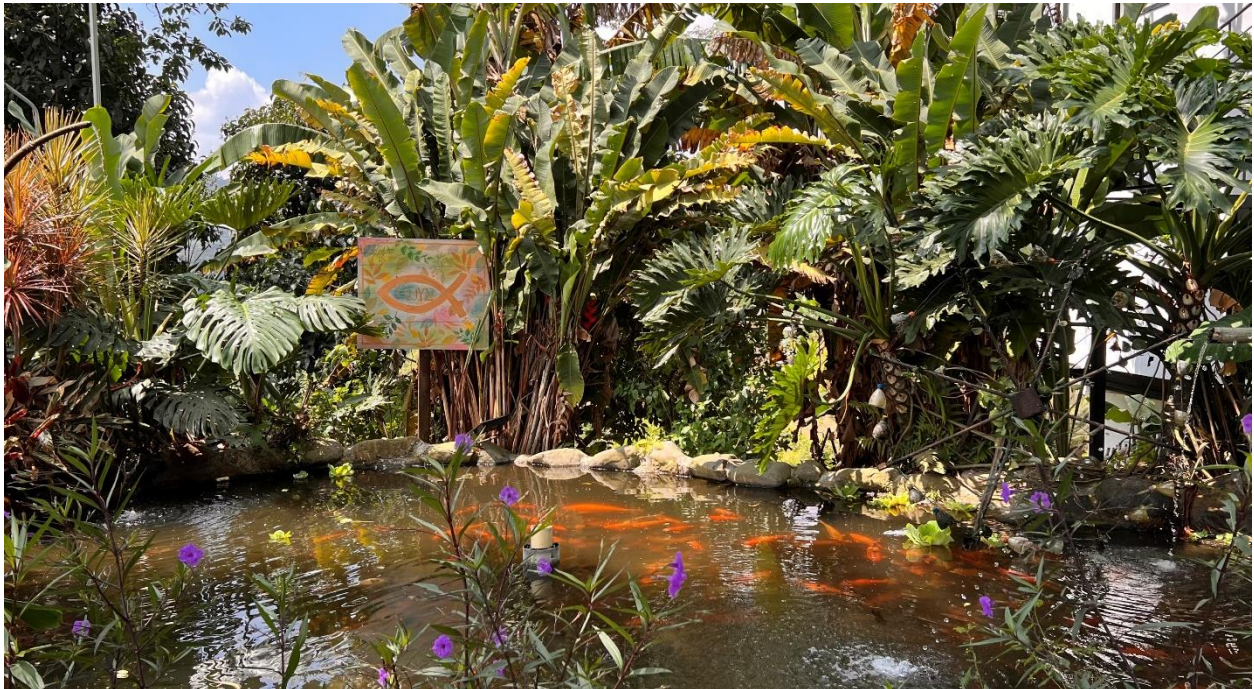
Ilustración 2: Estanque de Peces Koi. Elaboración Propia.