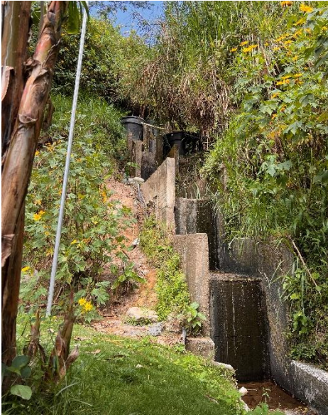
Ilustración 14: Captación del Agua. Elaboración Propia.