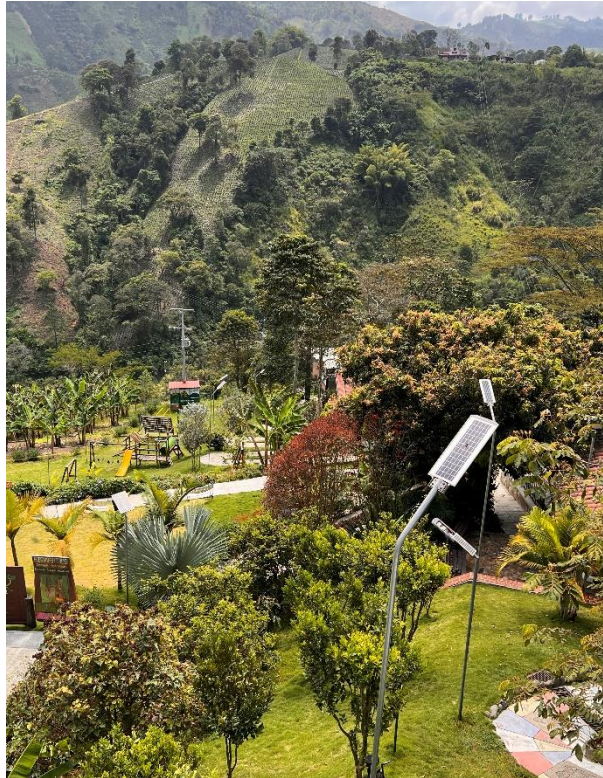
Ilustración 18: Disposición Paneles Solares Dentro de los Espacios de la Fundación . Elaboración Propia.