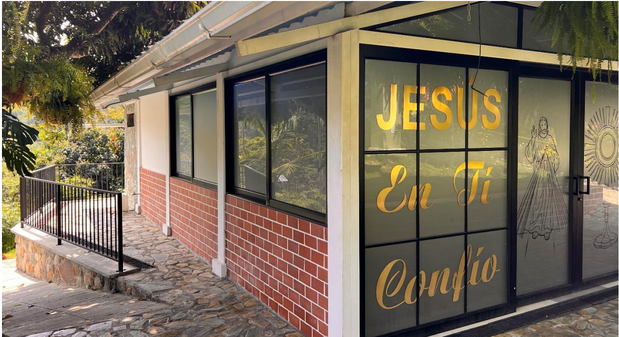
Ilustración 3: Capilla de la Misericordia. Elaboración Propia.