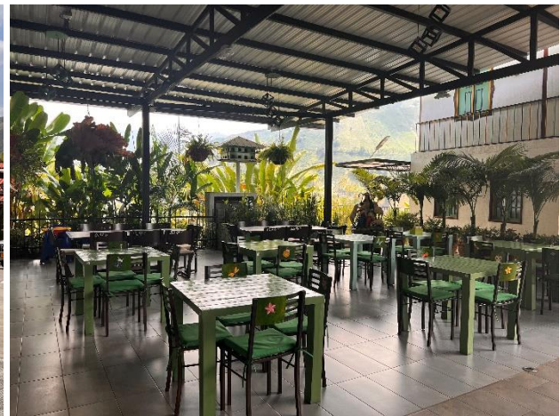
Ilustración 12: Cantarrana. Elaboración Propia.