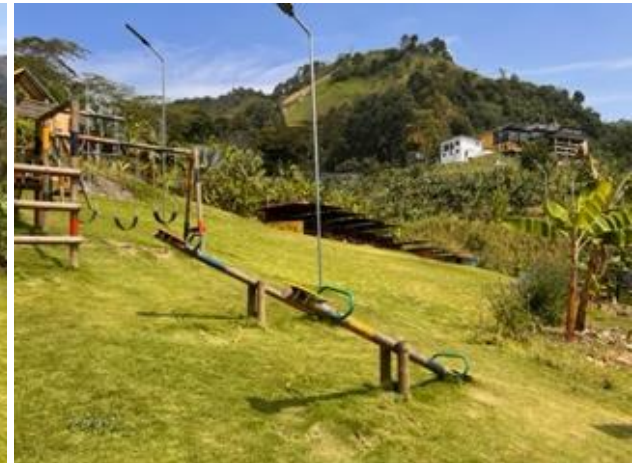
Ilustración 7: Zona Picnic. Elaboración Propia.