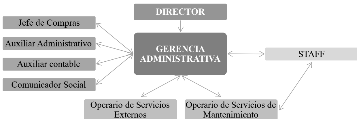
Gráfico 1: Organigrama y Áreas Funcionales de la Organización. Elaboración Propia.