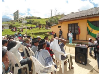
Reunión con padres de familia orientado por la psicóloga 2013