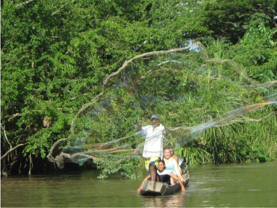
Ilustración 1. El Pescador 1 .

Fotografía digital. Brazuelo del río Magdalena dentro de la isla Talavera de la Reina, Puerto Salgar Cundinamarca. 2009.