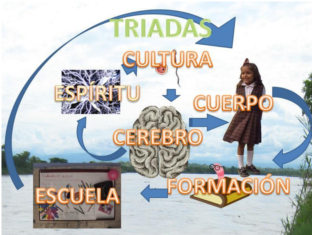
Ilustración 8. Circuito relacional.

Fotografía digital editada. Ciénaga de Guarinocito. La Dorada Caldas. 2009.