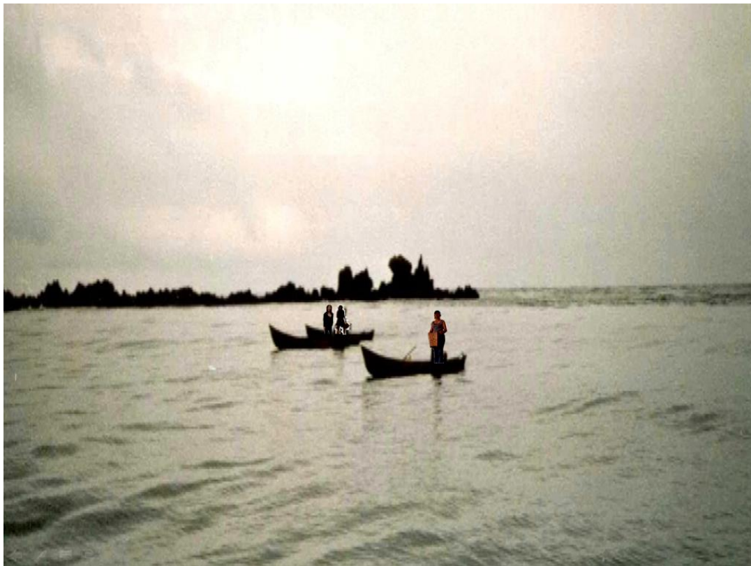
Ilustración 14. El río Magdalena y el mar Caribe 122 . Foto Digital Editada. Bocas de ceniza. 2009.

Considero que el peor defecto de la educación es el sistema escolar que opera fundamentalmente a base del temor, la coacción y la autoridad artificial de los maestros. Estos métodos destruyen el espíritu sano, la sinceridad y la confianza de los estudiantes en sí mismos y acaban produciendo seres sumisos.