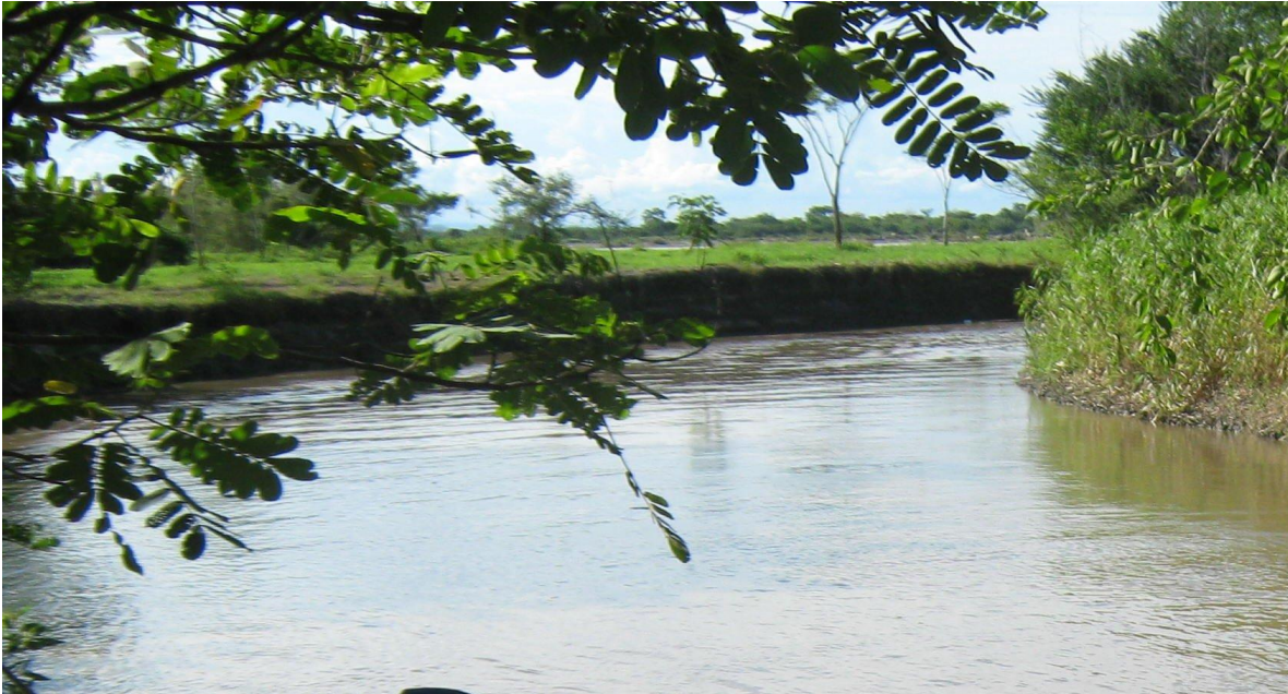
Ilustración 6. Esperanza 23 .

Fotografía digital. Brazuelo sobre el río Magdalena en la isla Talavera de la Reina. Puerto Salgar Cundinamarca. 2009.