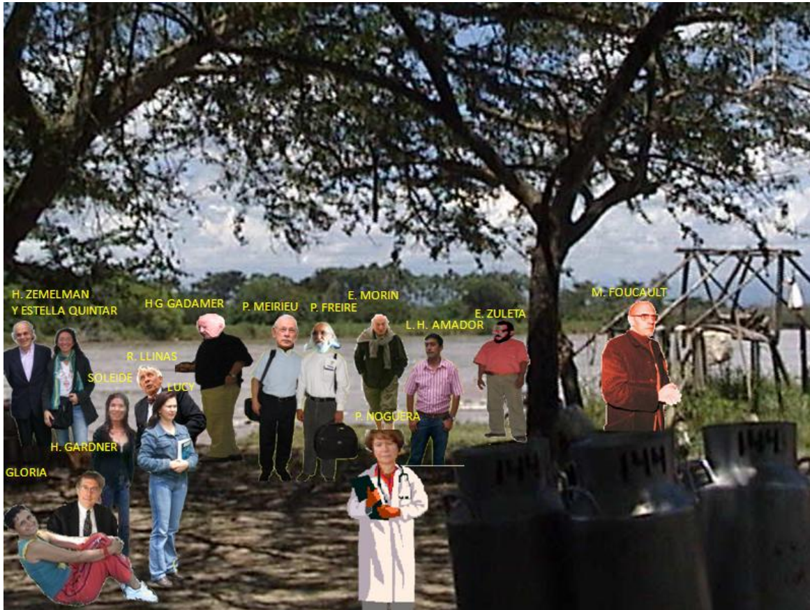
Ilustración 2. Navegantes 12 .

Fotografía digital editada. Ribera derecha del río Magdalena frente a la isla Talavera de la Reina. 2008.