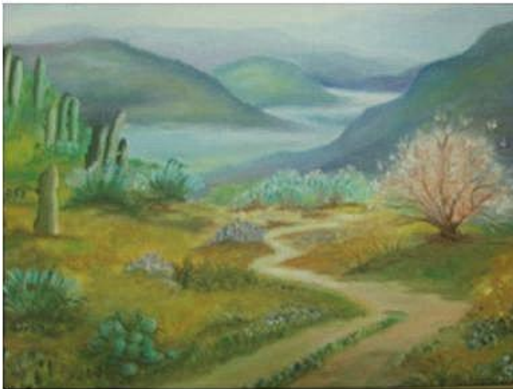
Ilustración 11. Colombia mía.