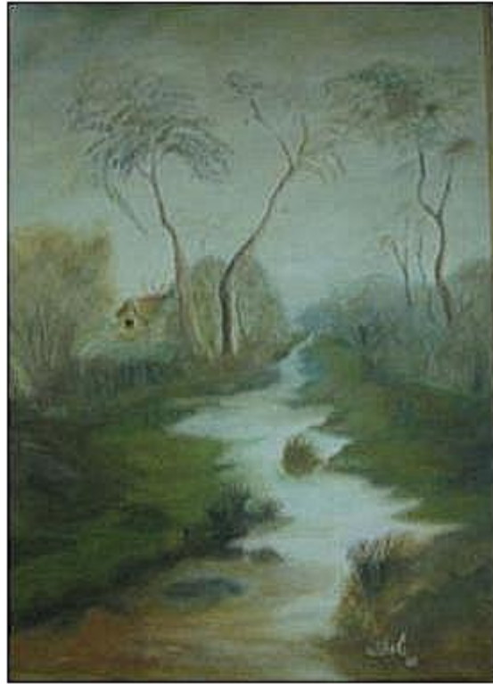
Ilustración 10. Alborada de otoño.

Oleo sobre lienzo 70x90 cm. 2009. Autora: Soleide Guevara Trejos. 55