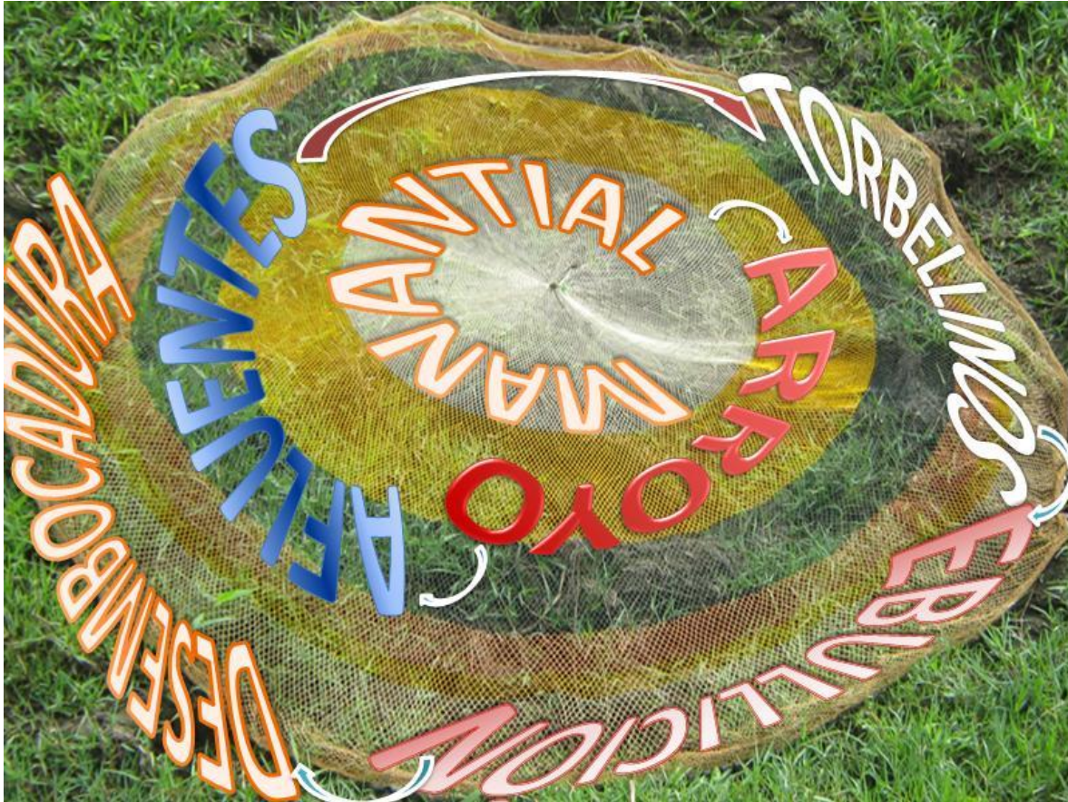
Ilustración 5. Complexus Hilada 22 .

Fotografía digital editada. Isla Talavera de la Reina en el río Magdalena. Puerto Salgar Cundinamarca. 2009.