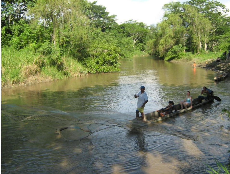
Ilustración 13. Los Aleas 106 .

Fotografía digital. Brazuelo sobre el río Magdalena en la isla Talavera de la Reina. Puerto Salgar Cundinamarca. 2009.