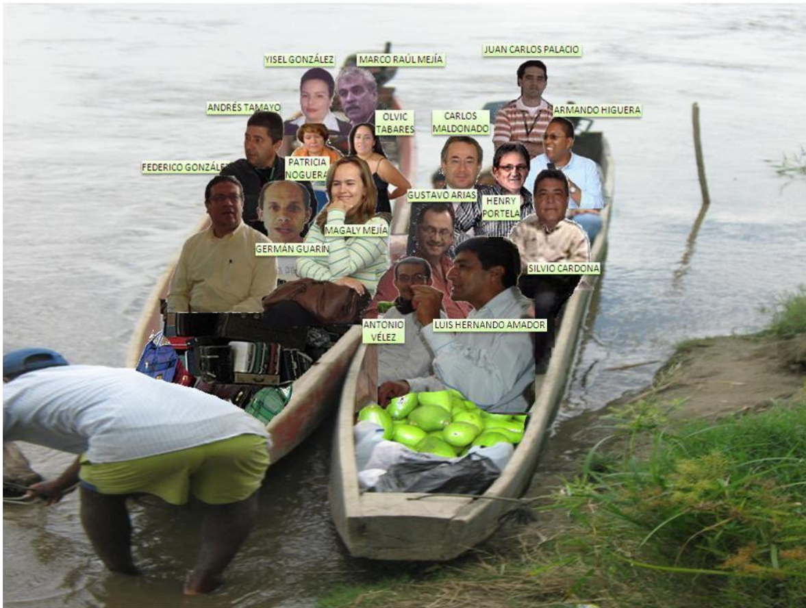
Ilustración 3. Fecundadores 13 .

Fotografía digital editada. Ribera derecha del río Magdalena frente a la isla Talavera de la Reina. 2009.