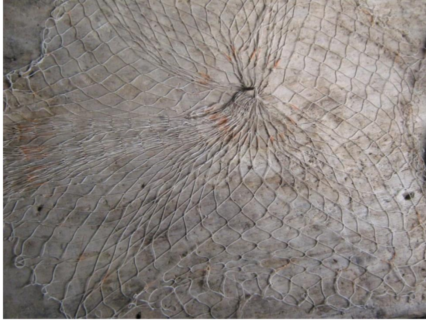
Ilustración 12. Trama. 92

Foto digital. Patio vivienda isla Talavera de la Reina. Pto. Salgar, Cundinamarca sobre el río Magdalena. 2009.