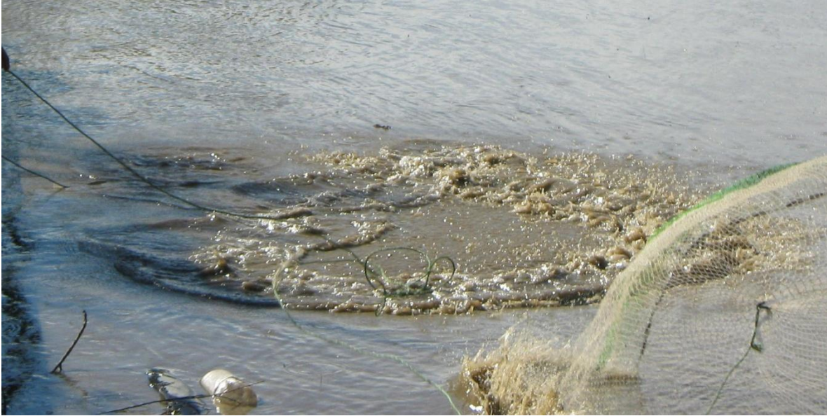
Ilustración 4. Remolino 14 .

Fotografía digital. Río Magdalena frente a la isla Talavera de la Reina. 2009.