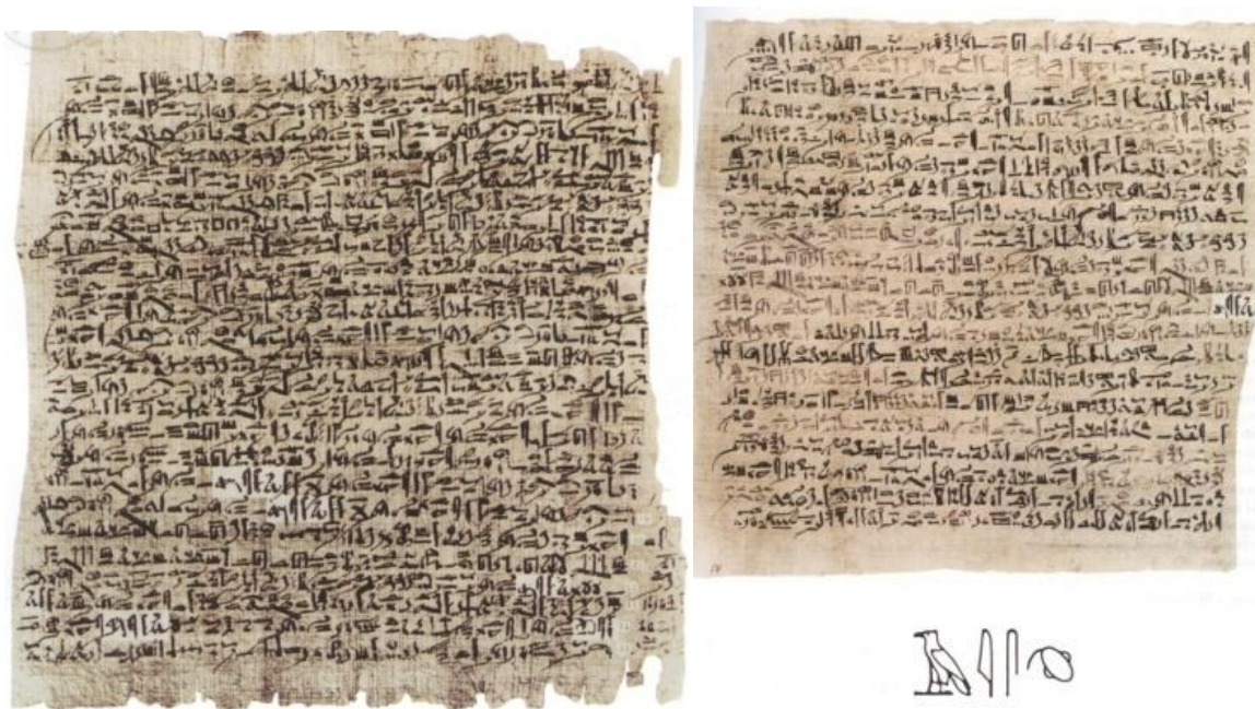
Ilustración 9. Papyrus

Columna II (izquierda) y IV (derecha) del Edwin Smith Surgical Papyrus 50