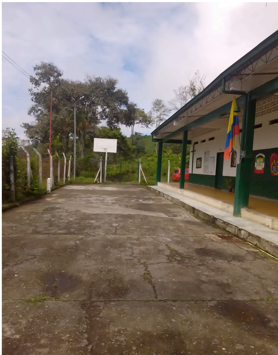
Escuela nueva vereda Javas - municipio de Manizales.