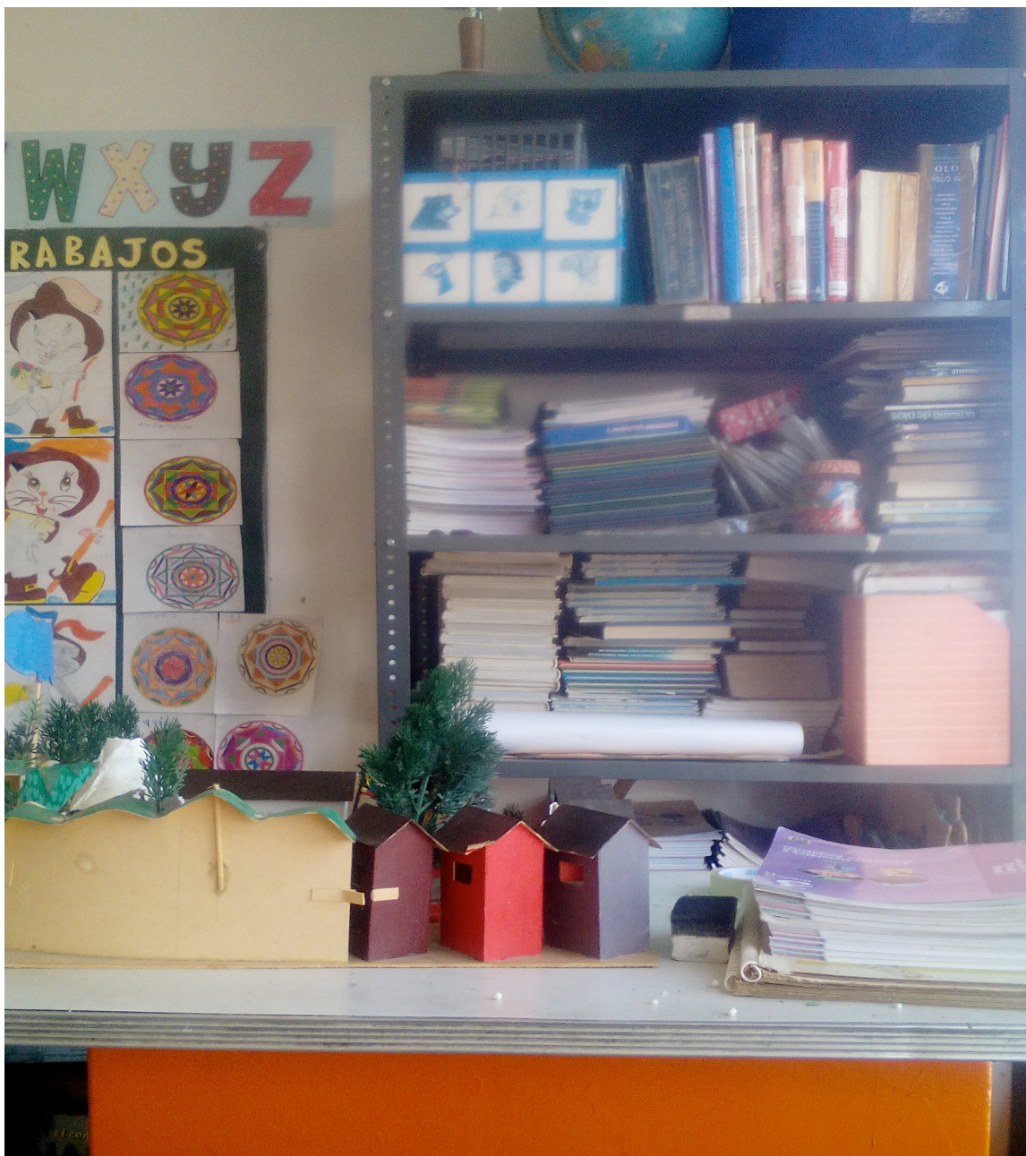
Estantería utilizada como biblioteca, escuela El Aventino – municipio de Manizales