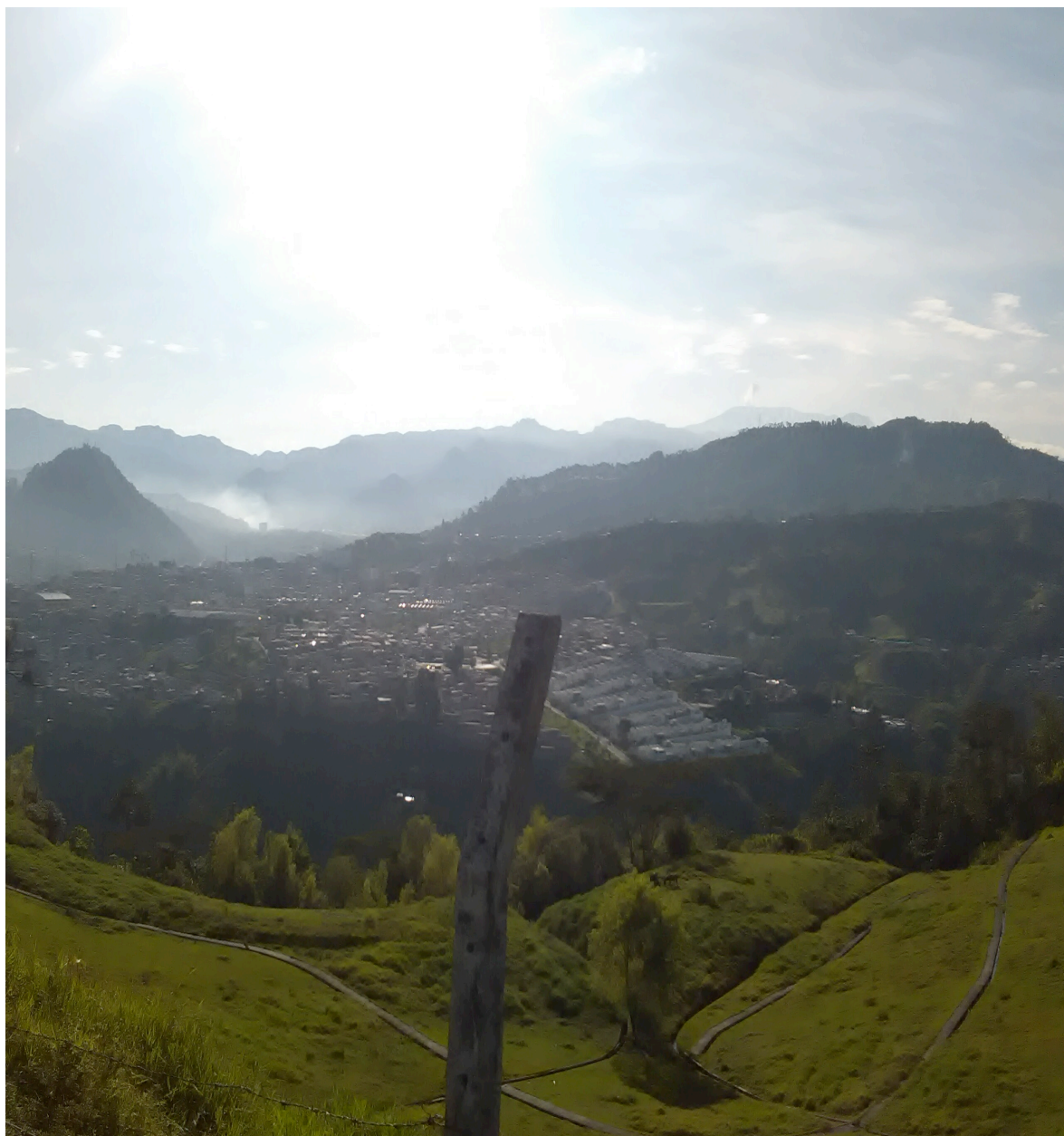
Panorámica del municipio de Villamaria desde la vereda Alto Tablazo - municipio de Manizales.