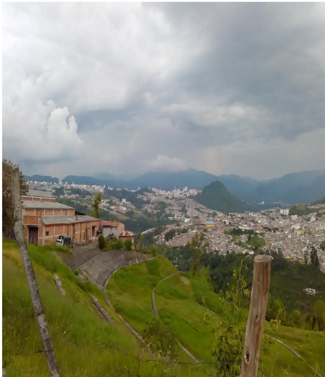
Panorámica de la ciudad desde la vereda Alto Tablazo-Municipio de Manizales