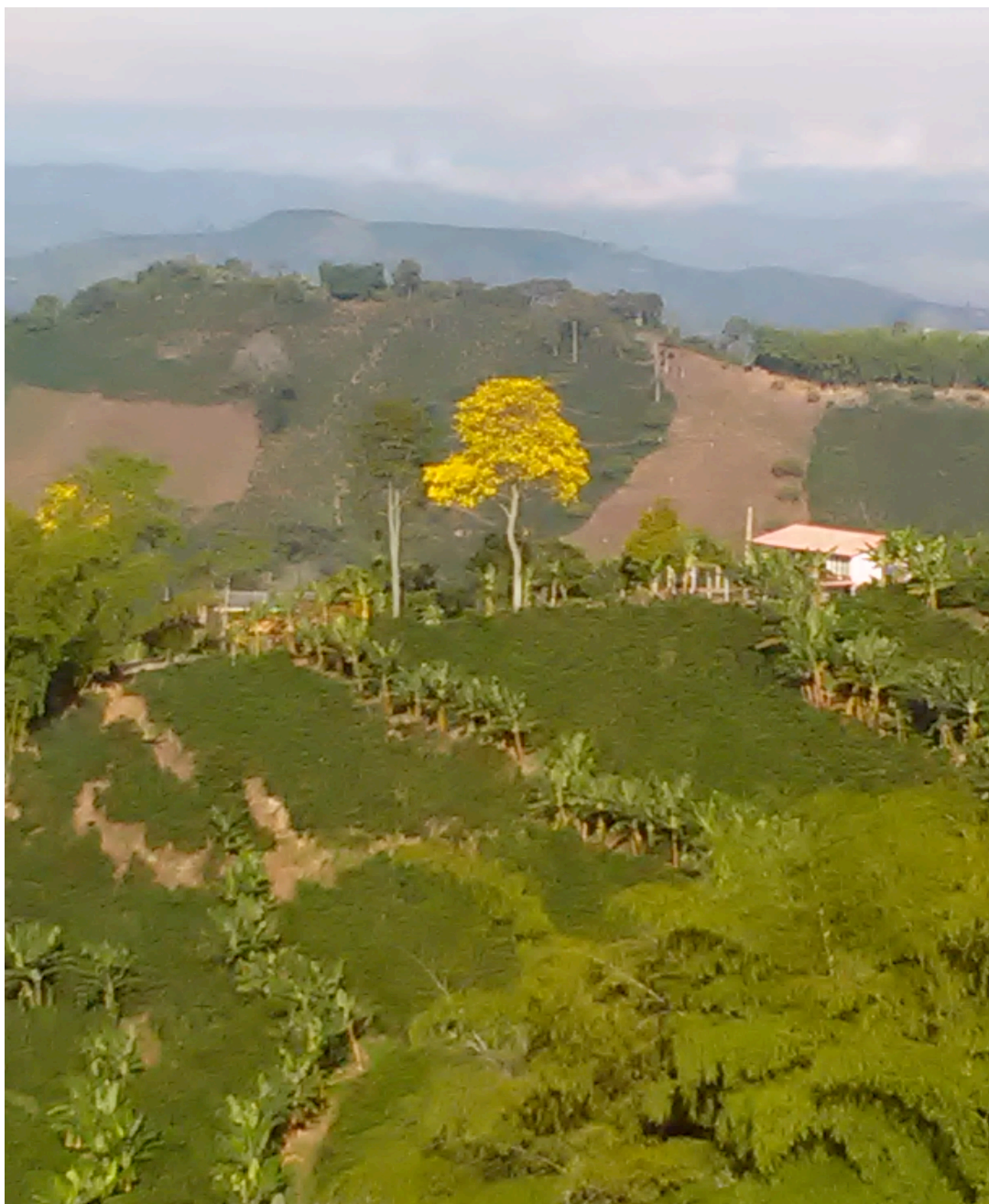
Cultivo de café y plátano, vereda El Aventino - Municipio de Manizales.