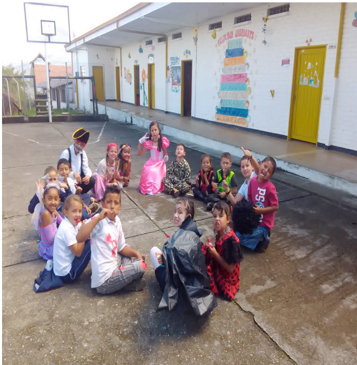
Celebración día de brujitos y brujitas, vereda el Alto del Naranjo- municipio de Manizales