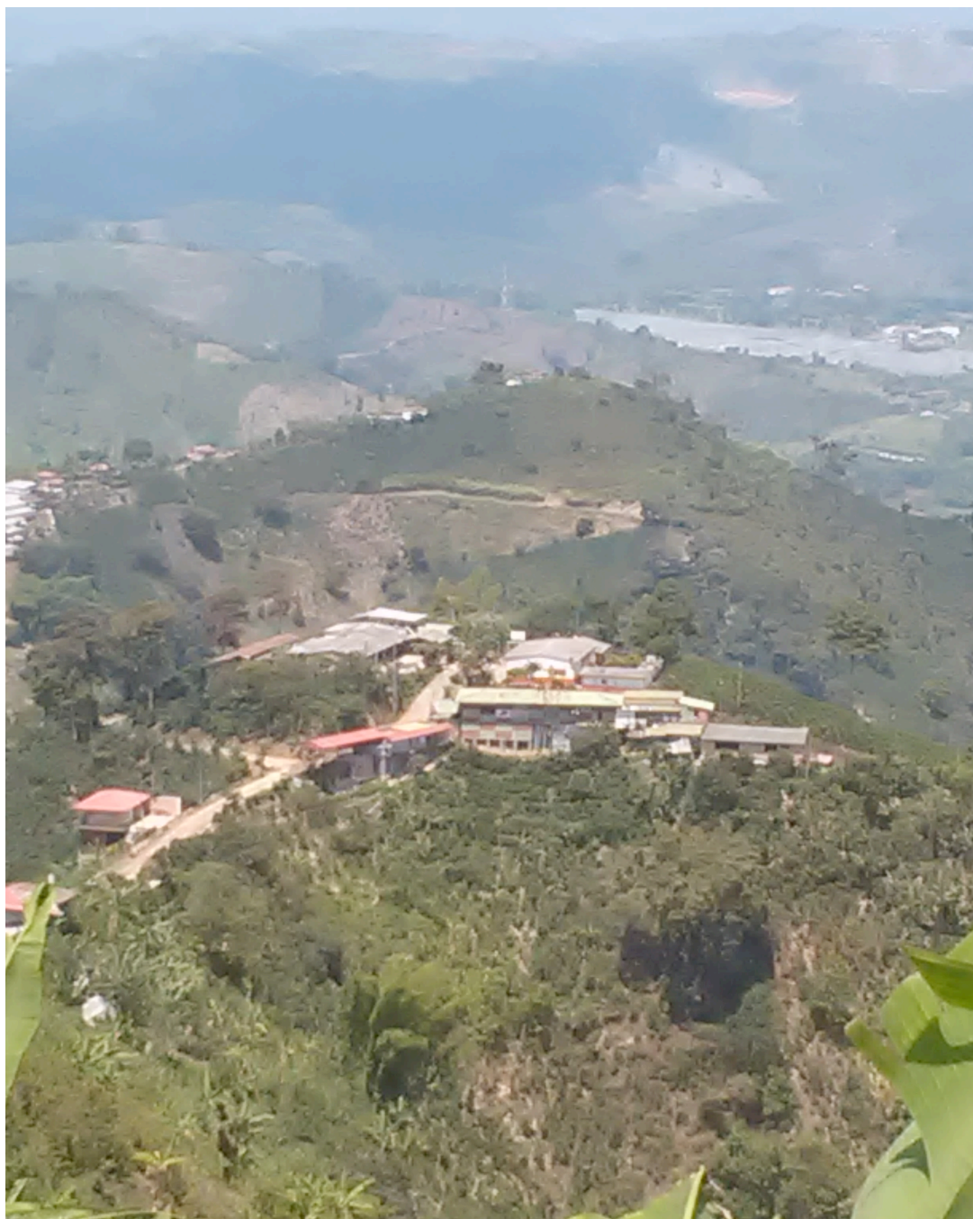
Panorámica Vereda Guacas-municipio de Manizales