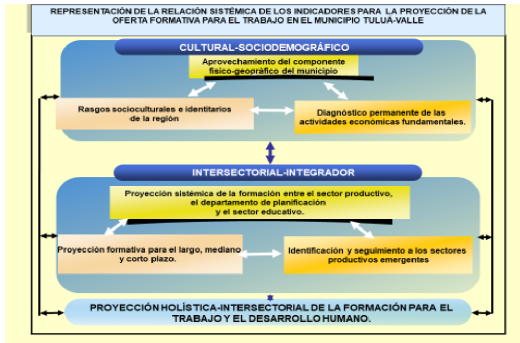
Cuadro2: Representación sistémica entre los indicadores. Elaborado por la autora.

desarrollo humano, capaz de responder a las demandas laborales y los rasgos culturales-sociodemográficos más significativos de la región.