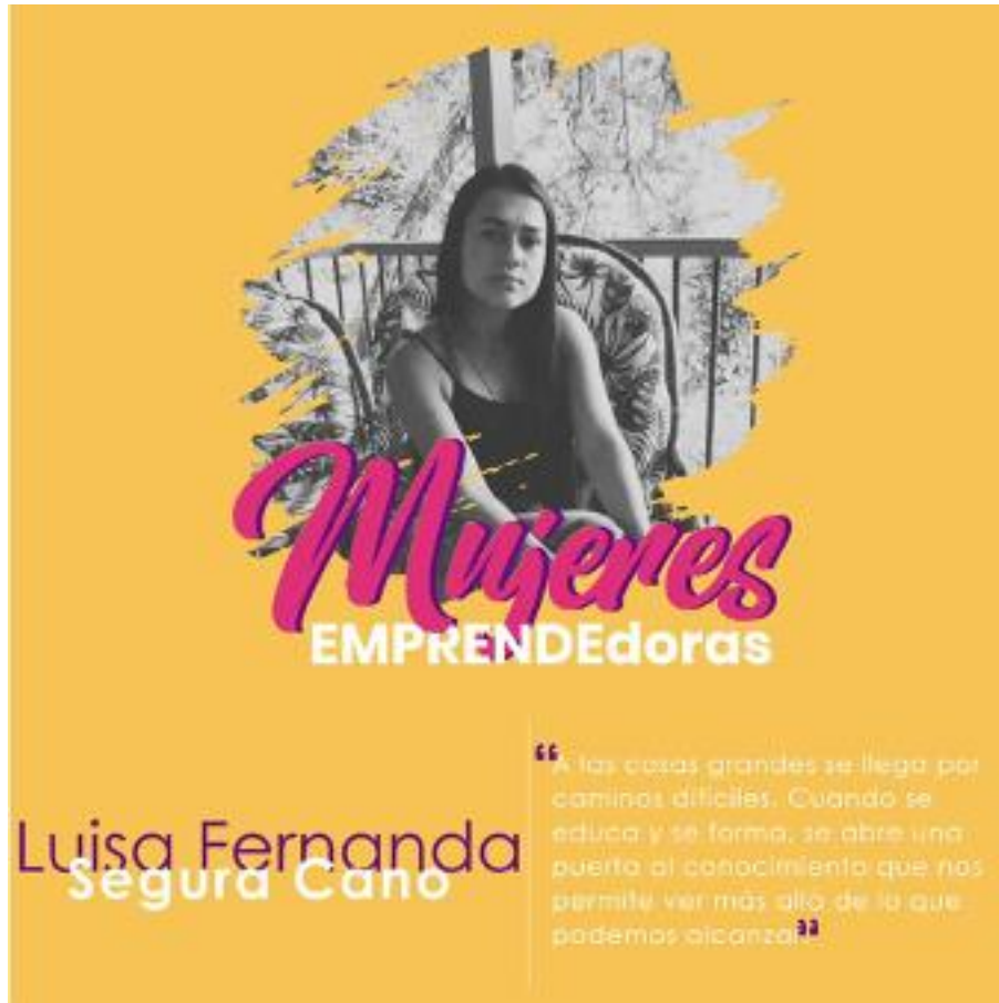
Imágen 4 Imágen promocional de evento