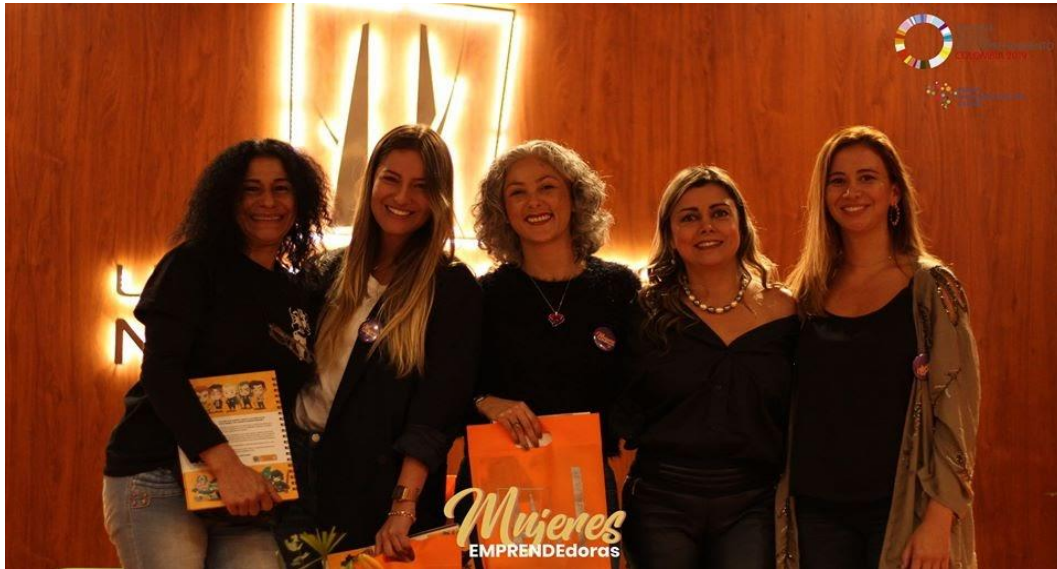
Imágen 7 Ponentes del evento - Repositorio Unidad de Emprendimiento U. de Manizales