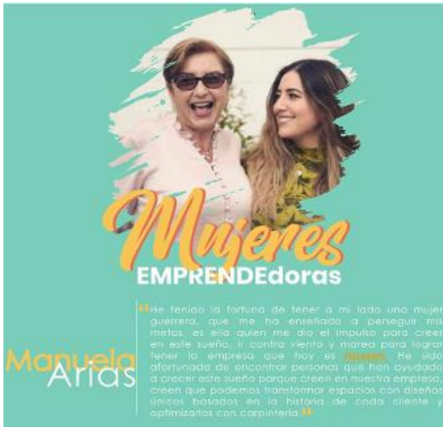
Imágen 3 Pieza promocional del evento

programa Adventure Más de Manizales Más, quienes fueron parte fundamental en su proceso de indagación y formulación de proyecto para que su empresa se convirtiera de alto potencial, teniendo un aproximado de ventas entre 80 y 500 millones de pesos anuales, pasando a vender más de 600 millones de pesos anuales.