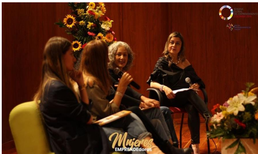
Imágen 8 Conversatorios durante el evento - Repositorio Unidad de Emprendimiento U. de Manizales

El apoyo publicitario fue esencial para la realización de este evento, ya que por medio de esto se motivó a todas las personas para asistir a este, se realizaron diversas piezas publicitarias que tuvieron difusión masiva por medios digitales (Facebook, instagram y canales institucionales), se contó con el acompañamiento de medios de comunicación masivos locales (Canal regional telecafé, La patria TV, y el periódico La Patria); para realizar la comunicación del evento fue necesario realizar un estudio de target que sirvió para ser contundente y saber a qué población se quería llegar.