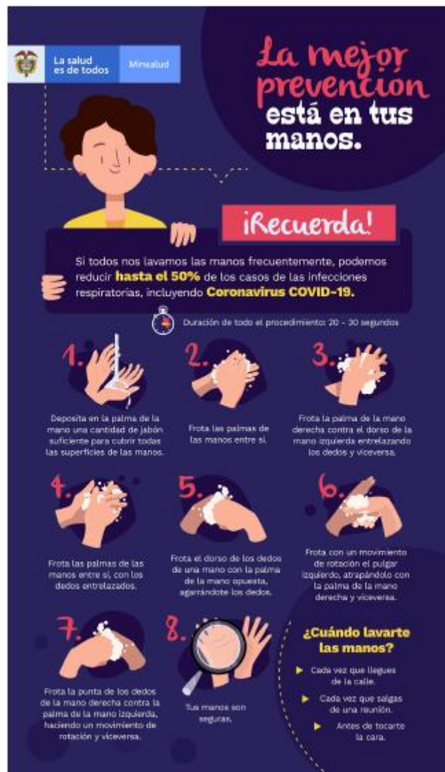
Ilustración 1. Procedimiento lavado de manos