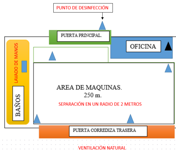
Gráfico 1. Identificación del área del gimnasio

A continuación, se hace la descripción del área del gimnasio, se define el número de personas que pueden permanecer en un área respetando los 2 metros de distanciamiento, las cuales estarán demarcadas y señalizadas. A continuación, se presenta una identificación del área, a partir de un gráfico: