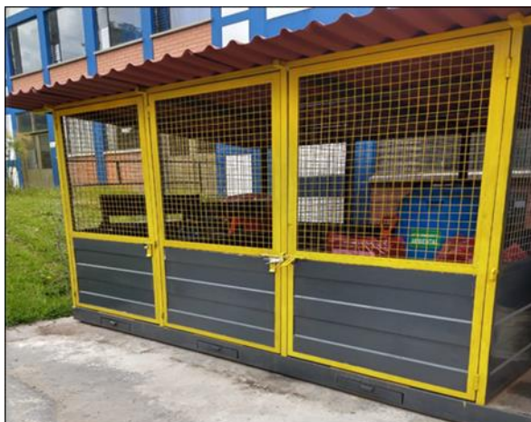
Fotografía 1. Centro de acopio de residuos peligrosos