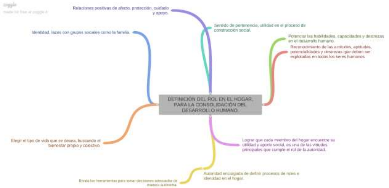
Gráfica 7, desarrollo humano y definición de roles en el hogar.