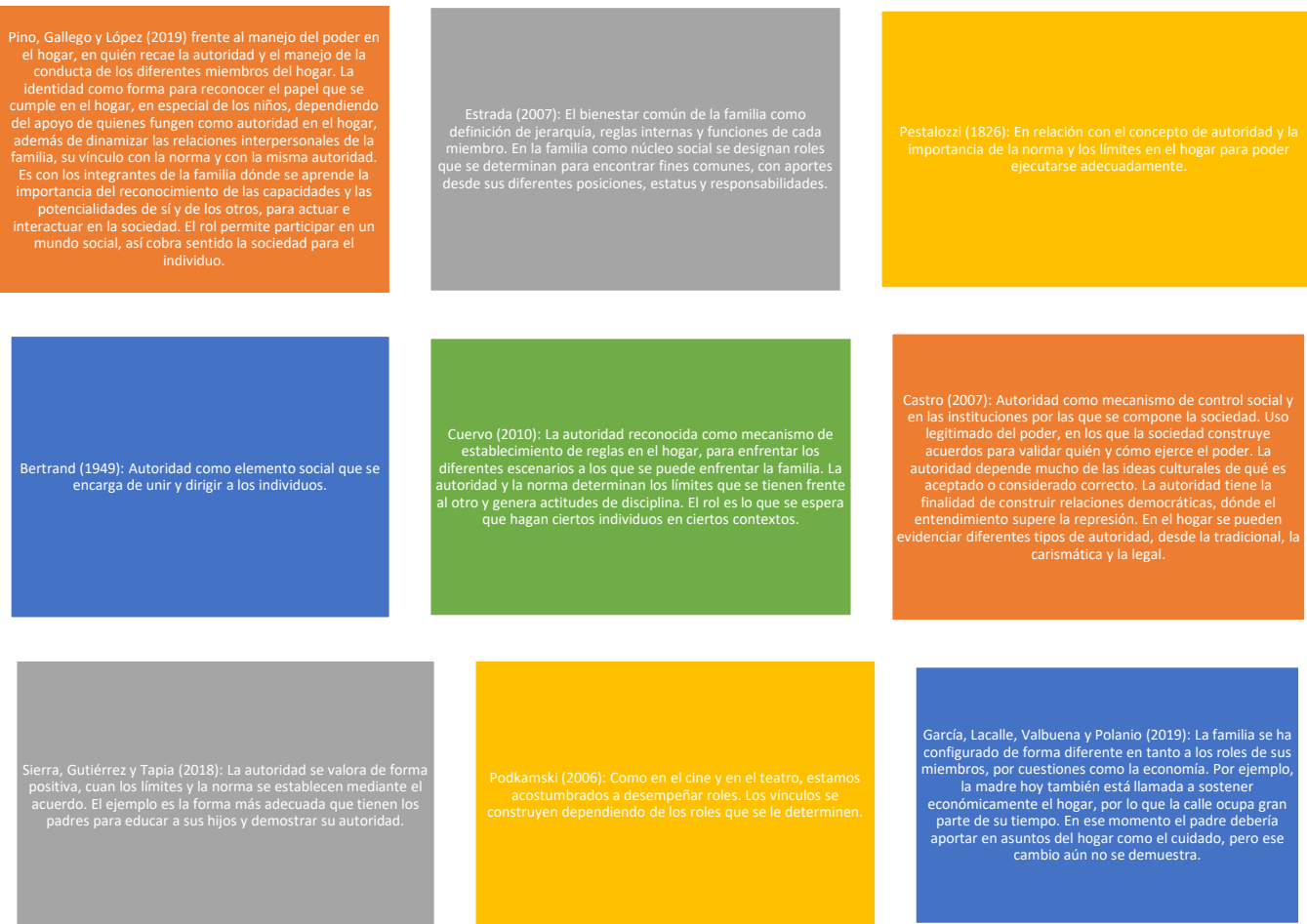
Gráfica 1. Teorización concepto de autoridad.

adecuada de roles en el hogar, se tendrán en cuenta los postulados de los siguientes autores: