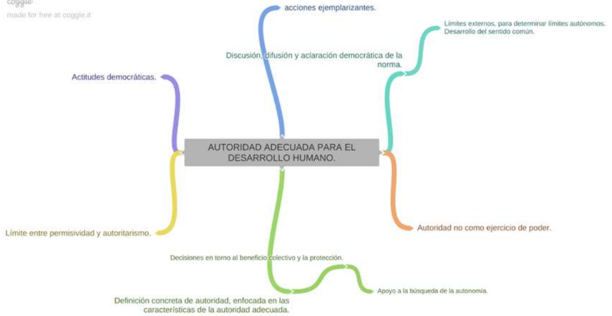
Gráfica 6, autoridad adecuada y desarrollo humano.