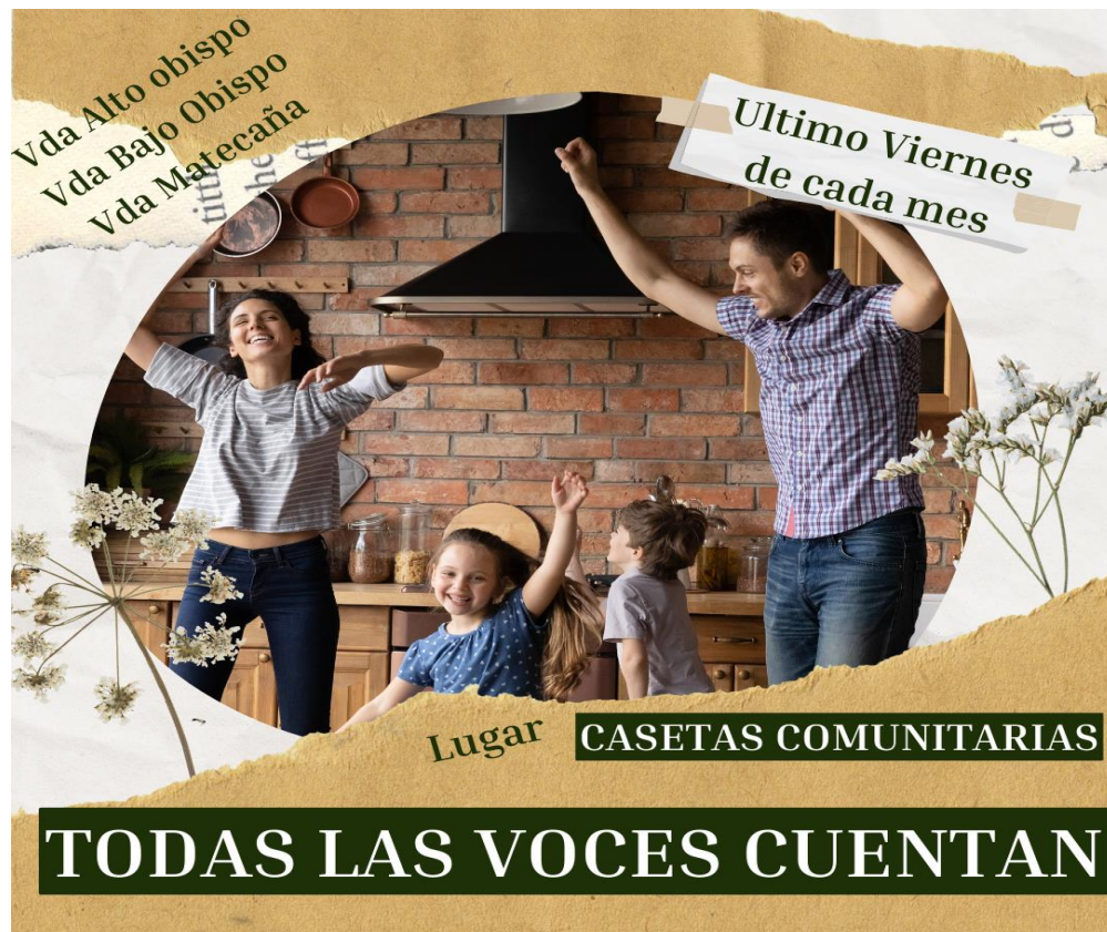
Figura 5. Propuesta de poster para el encuentro dialógico con las familias.

Como segunda estrategia se plantea un encuentro grupal, la invitación al espacio es la siguiente: