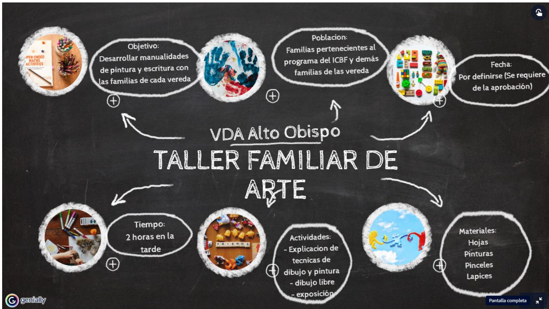
Figura 4. Descripción del taller para realizar con las familias. Fuente de la Plantilla: Genially