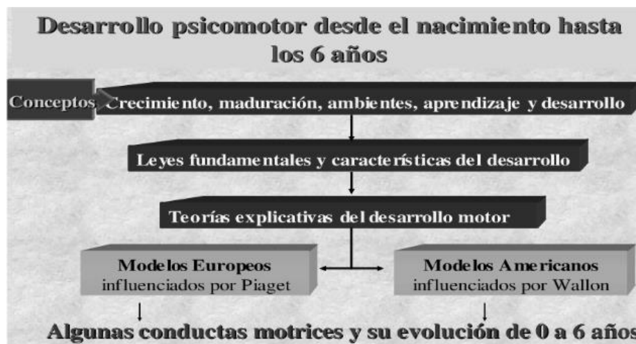
Figura 1. Desarrollo psicomotor desde el nacimiento hasta los 6 años.

En relación con el desarrollo de las capacidades motoras, Gil (2003), explica que el desarrollo psicomotor del niño desde que nace hasta los 6 años está influenciado por factores sociales y en parte por la herencia, en tanto el desarrollo motriz está estrechamente relacionado con las conductas hereditarias y lo que aprende en su cotidianidad, para ello expone la siguiente gráfica: