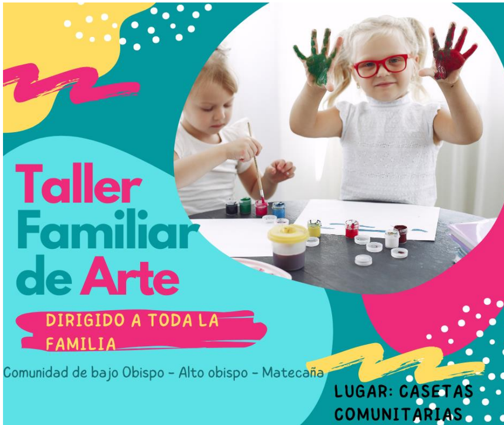
Figura 3: Propuesta de poster para taller con las familias. Fuente de la Plantilla: Canva.