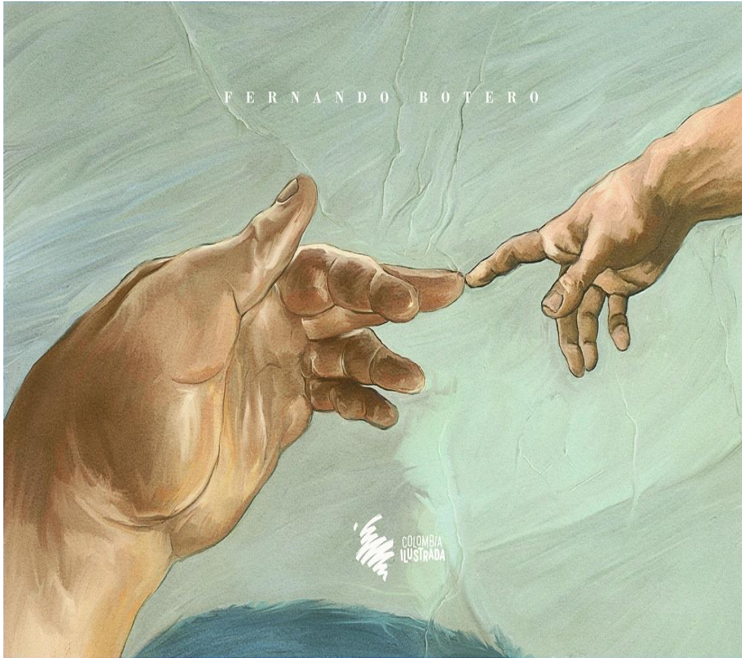
Imagen: Fernando Botero, Colombia ilustrada 8