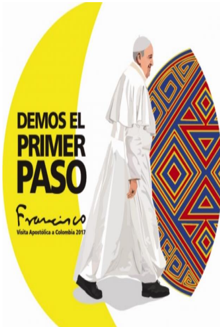
Imagen: El Papa en Colombia: “Demos el primer paso” 14

Dichoso aquel... cuya esperanza es el Señor su Dios” 13