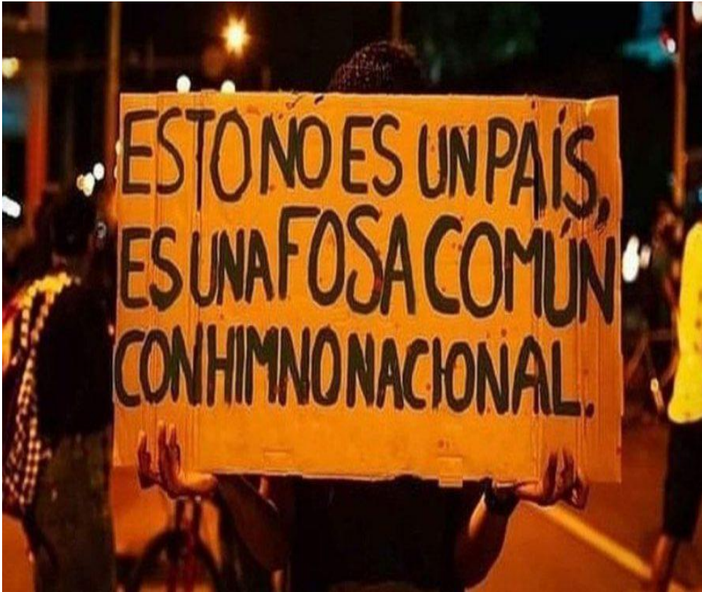
Imagen: un reflejo de la crisis humanitaria que atraviesa Colombia DD.HH. 2021 10

Presentamos a continuación un inventario de las representaciones sociales que, como hemos visto, han ido transversalizando nuestra investigación, y ahora, con un mayor sentido, dos acciones principales. Primero, lo que ellas nos dicen y lo que nos permiten aproximarnos al fenómeno problemático de la crisis moral, segundo, qué nos hacen decir, y ya sabemos también, qué representación social nos emerge en tanto lo que alcanzamos humanamente a vislumbrar de salida a la crisis moral en Colombia.